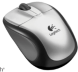
Logitech® Wireless Mouse M305