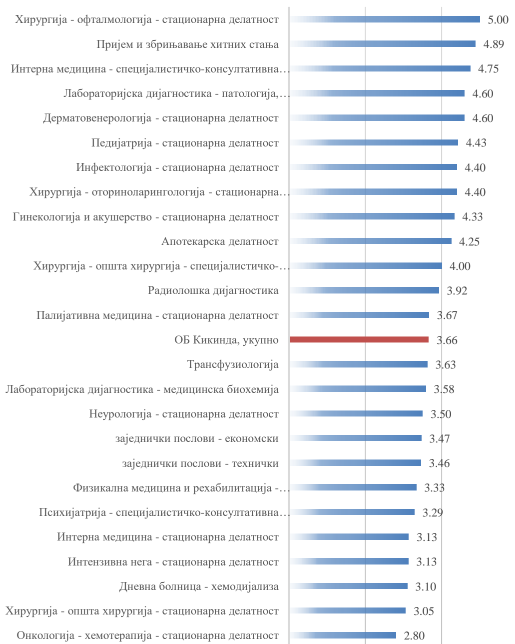
Графикон 4. Дистрибуција општег задовољства запослених послом који обављају по организационим јединицама, 2024. година.