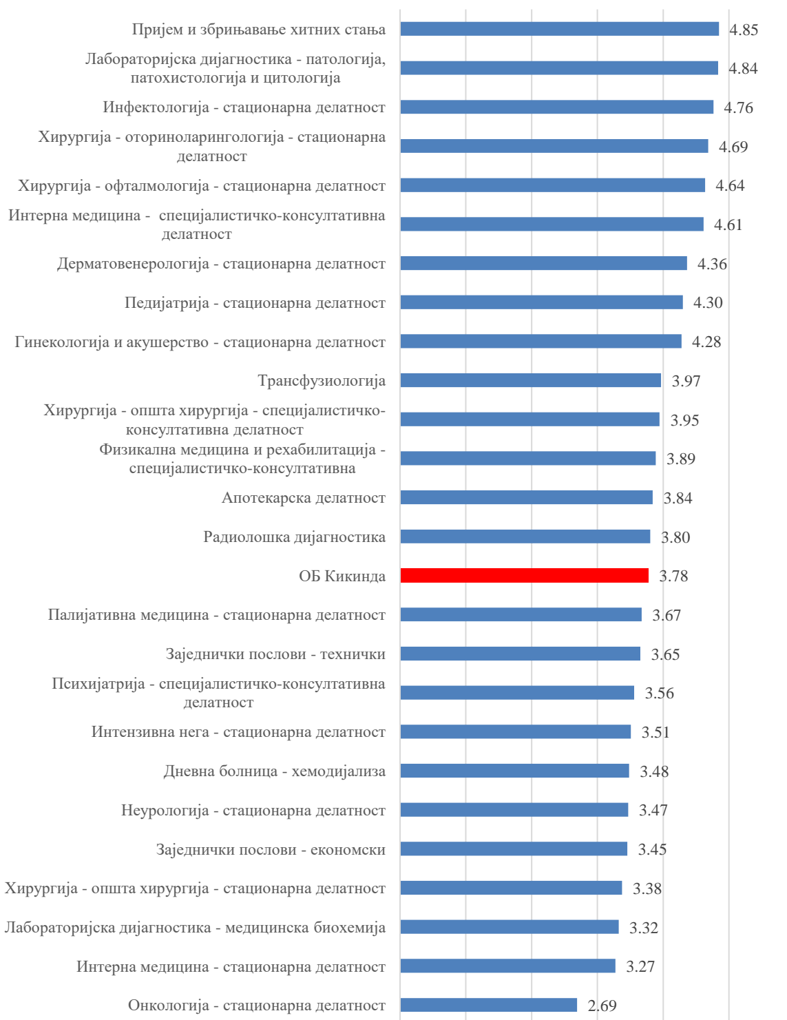
Графикон 3. Просечне оцене карактеристика радног места укупно по службама – приказано опадајућим редоследом 2024. годину