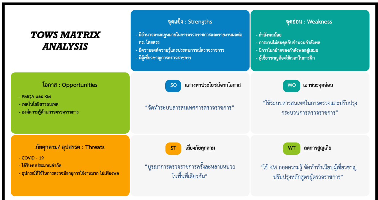
ภาพที่ ๒ - ๒ TOWS Matrix Analysis ของ จร.ทร.