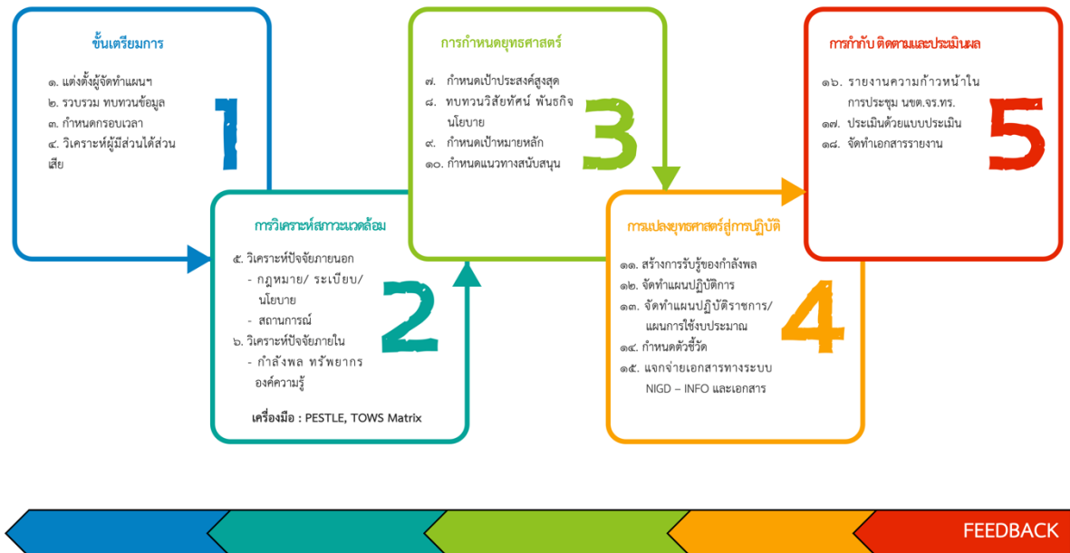
ภาพที่ ๒ - ๑ ขั้นตอนการวางแผนยุทธศาสตร์ของ จร.ทร.

เพื่อให้กองทัพเรือนำข้อมูลการตรวจราชการของ จร.ทร. ไปใช้ในการพัฒนากองทัพได้อย่างมีประสิทธิภาพนั้น จร.ทร. กำหนดให้กองแผนและโครงการ (กผค.จร.ทร) เป็นหน่วยงานหลักของ จร.ทร. ในการวิเคราะห์ วางแผนและจัดทำแผนยุทธศาสตร์ของ จร.ทร. มีจุดมุ่งหมายเพื่อการเป็นเลิศในการตรวจราชการ จึงวางแผนยุทธศาสตร์ให้สอดคล้องกับยุทธศาสตร์ ทร. ๒๐ ปี แผน ทร. ๕ ปี และนโยบาย ทร. อีกทั้งนำปัจจัยต่างๆ ที่มีผลต่อการตรวจราชการ รวมทั้งภัยคุกคามและสถานการณ์ที่เกิดขึ้นในปัจจุบัน รวมทั้งการใช้ประโยชน์จากความก้าวหน้าของเทคโนโลยีสารสนเทศมาทำการประเมินทั้งในด้านประสิทธิผลและประสิทธิภาพ มีกระบวนการจัดทำแผนยุทธศาสตร์ของ จร.ทร. รวมทั้งการถ่ายทอดสู่การปฏิบัติรวม ๕ ขั้นตอน ประกอบด้วย ๑) ขั้นตอนเตรียมการ ๒) การวิเคราะห์สภาวะแวดล้อม ๓) การกำหนดยุทธศาสตร์ ๔) การแปลงยุทธศาสตร์สู่การปฏิบัติ ๕) การกำกับ ติดตามและประเมินผล (ตัวชี้วัด ๑.๑ - ๑.๖)