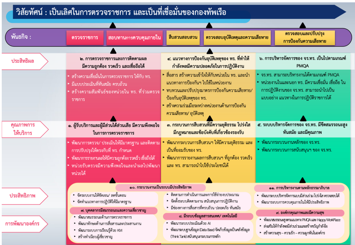
ภาพที่ ๒ - ๔ แผนยุทธศาสตร์ของ จร.ทร.