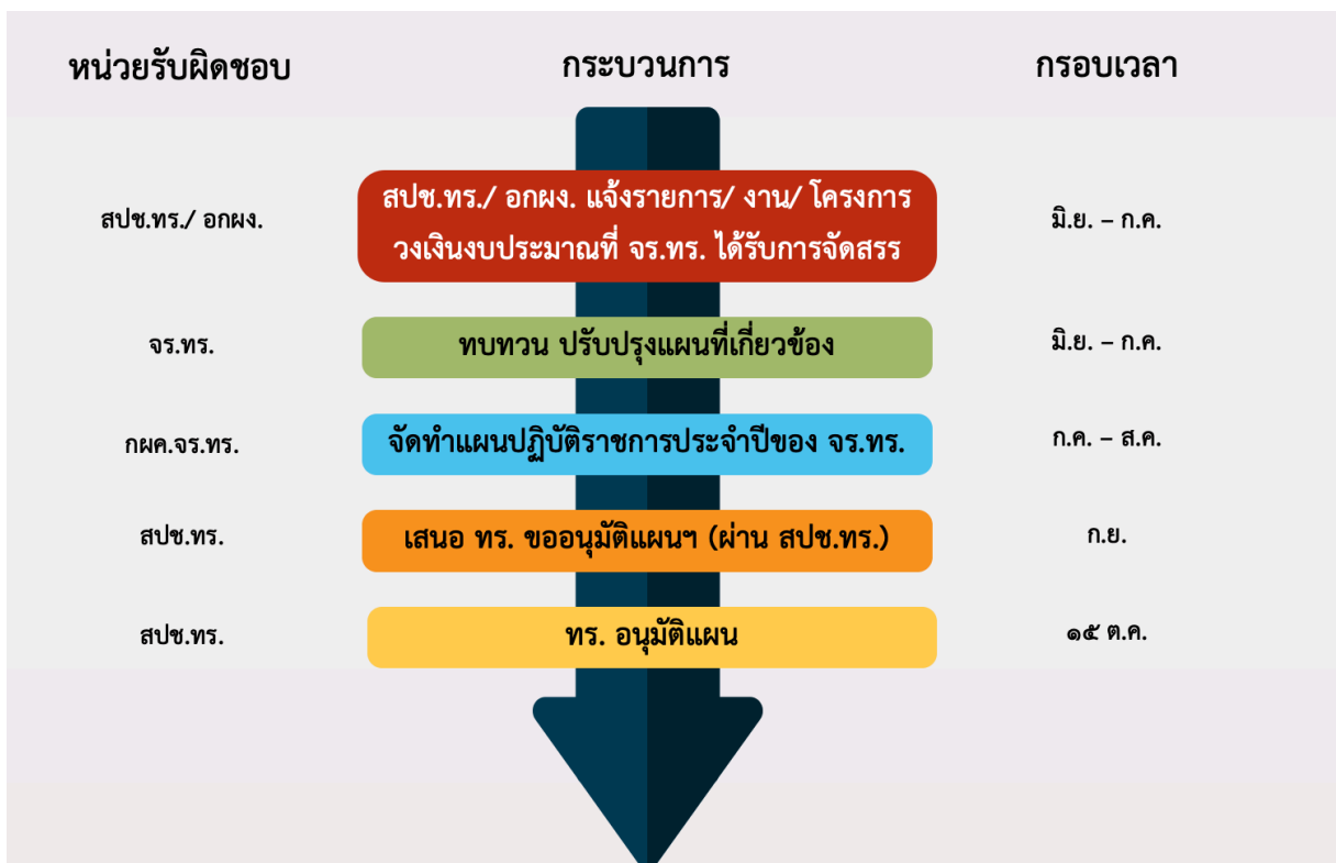
ภาพที่ ๒ - ๖ กระบวนการจัดทำแผนปฏิบัติการประจำปีของ จร.ทร.