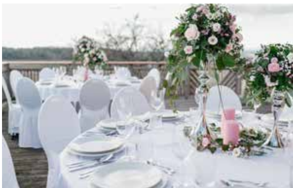
Sitzplätze mit runden Tischen auf der Terrasse bis 110 Personen