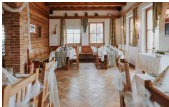
Sitzplätze im Stüberl bis 30 Personen