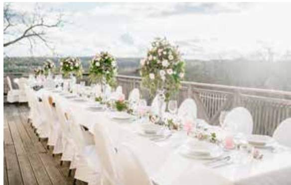
Sitzplätze mit Tafel auf der Terrasse bis 80 Personen