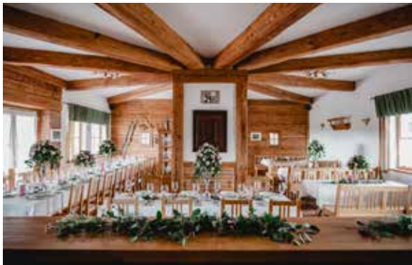
Tischanordnung bis 50 Personen

Sie Heiraten zwischen 26. Oktober und 15. April und die Saalmiete entfällt