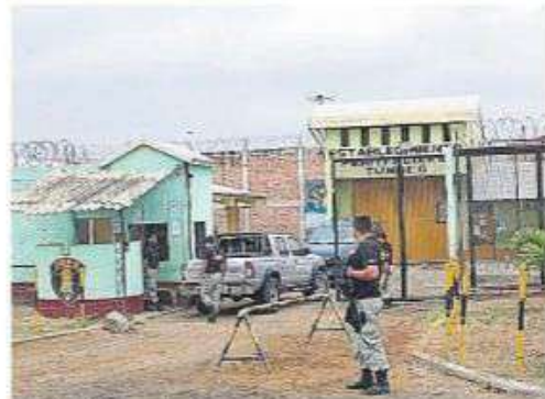
EN PRISIÓN. Hombre está encarcelado en penal Puerto Pizarro.

De esta manera, el sujeto aprovechó el momento para agredirla físicamente e intentar