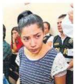
Fiden 12 años para acusados.