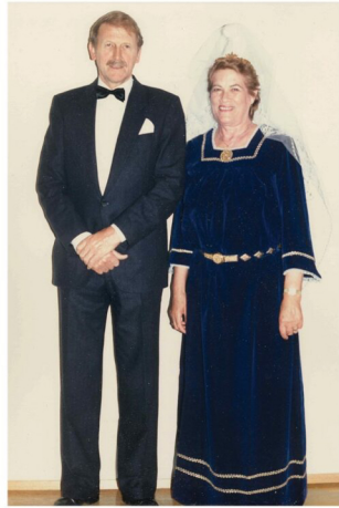
Blessuð sé minning þeirra.