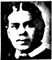
Elena G. de White