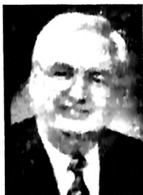
Roberto S. Folkenberg, anterior presidente de la Asociación General de los Adventistas del Séptimo Día.

E n una cárcel de Venezuela, un prisionero cayó de rodillas y miró hacia el cielo. Apretando un pequeño libro contra su pecho, con labios temblorosos, susurró algunas palabras. Con la conciencia herida, pero el corazón lleno de una recién descubierta gratitud expresada en palabras entrecortadas, pidió misericordia y perdón al Todopoderoso. El libro que sostenía en sus manos era una copia de El camino a Cristo , que amorosamente le había regalado un fiel laico. El prisionero daba así su primer paso. ¡Silencio! Nuestras publicaciones en acción.