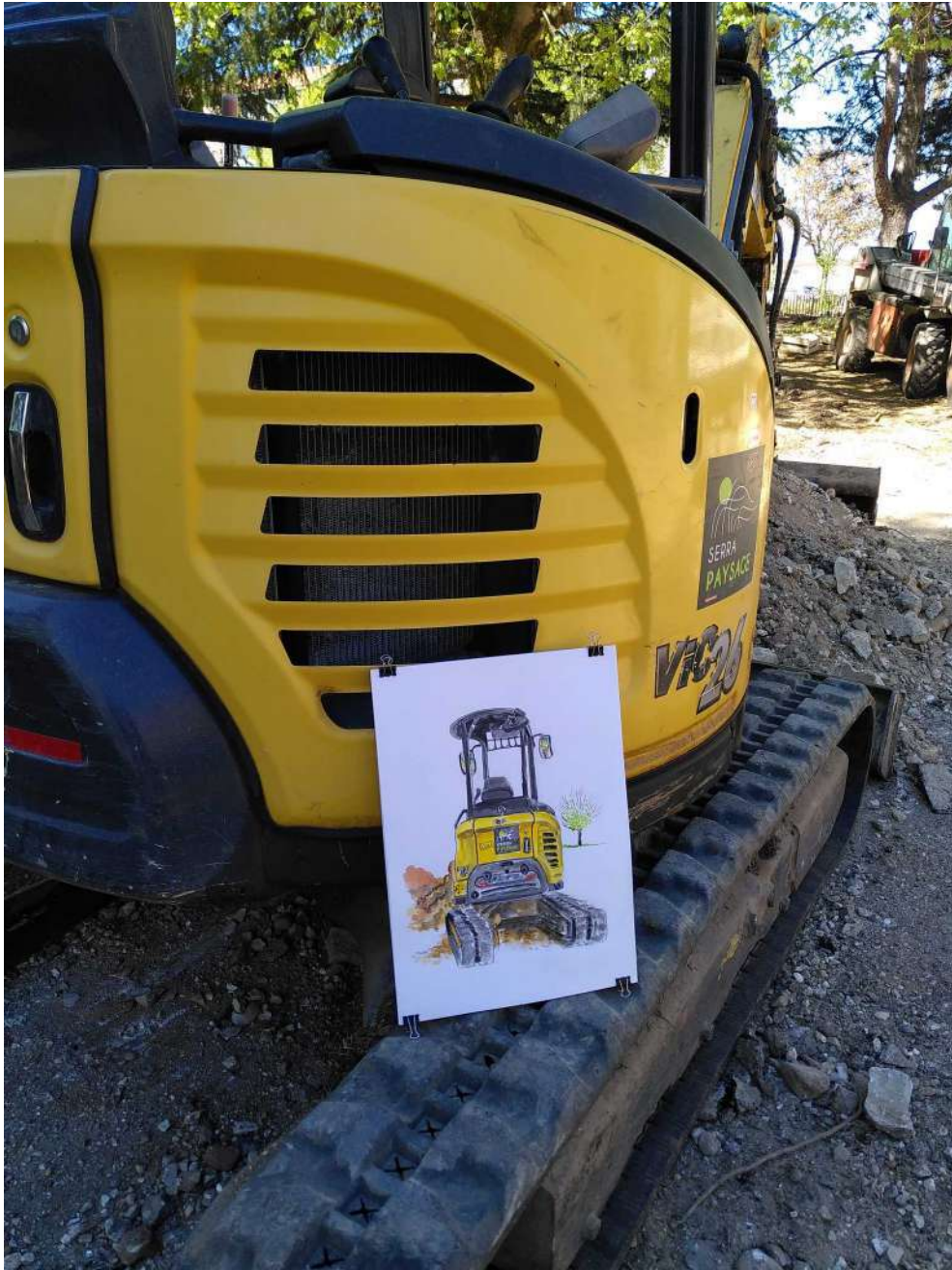
[aquarelle de Placid sur le motif de la machine de chantier des paysagistes]