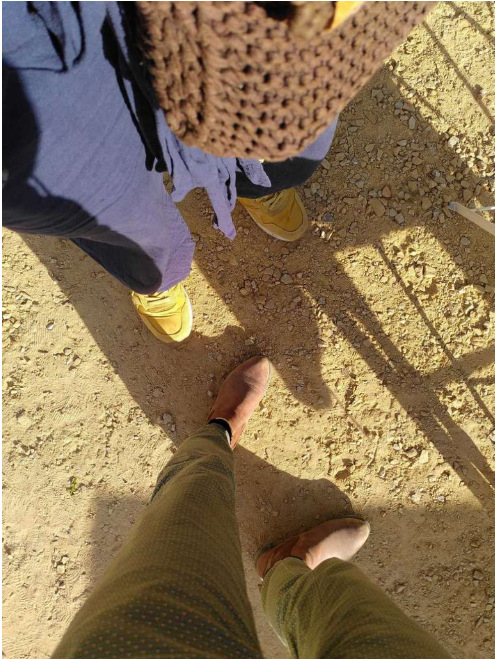
[Tu fais quoi ? demande Simon – Une photo de nos pieds. C'est cultures proches]