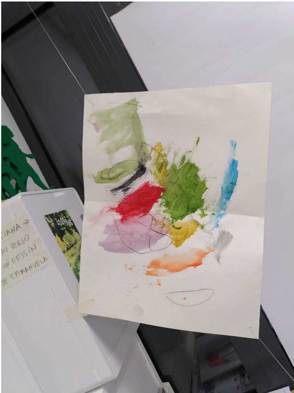
[le dessin de Tania qui a 4 ans est obliquement suspendu à un fil]