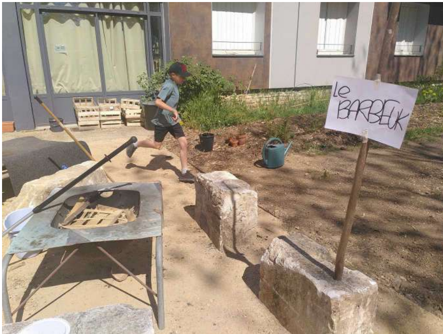
[l'homme qui dort à l'Assemblée et l'enfant qui court au Barbeuk]