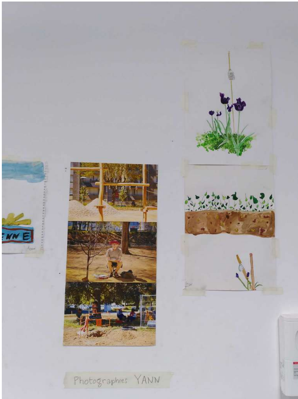
[Photographies de Yann, aquarelles de Placid et Anastasia]