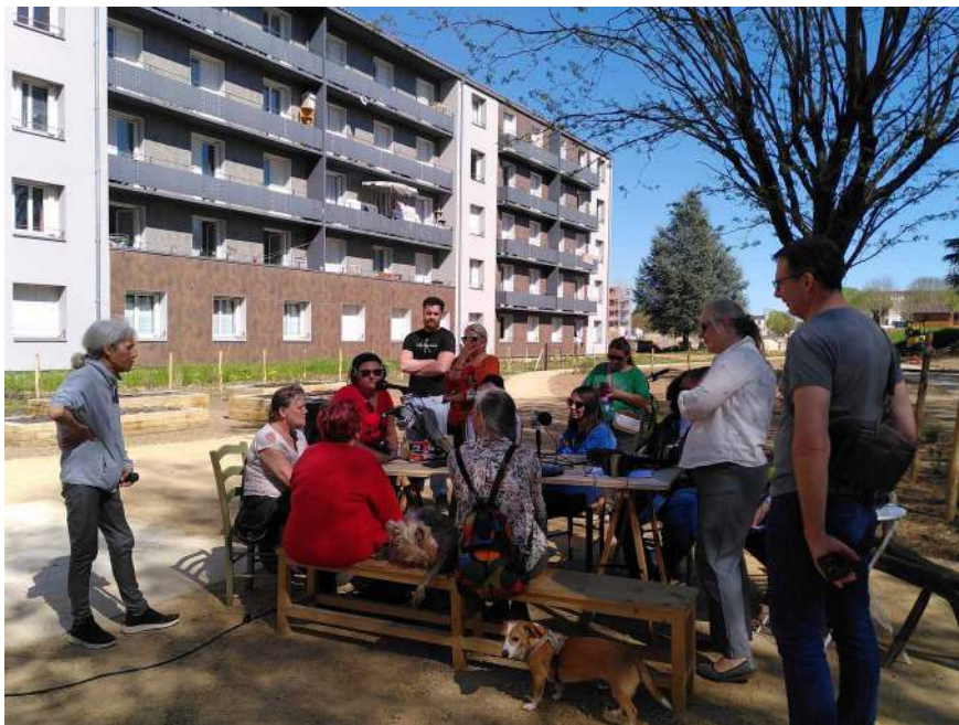
[le Jardin du Futur avec table pliante puis table pour causer à RLP radio]