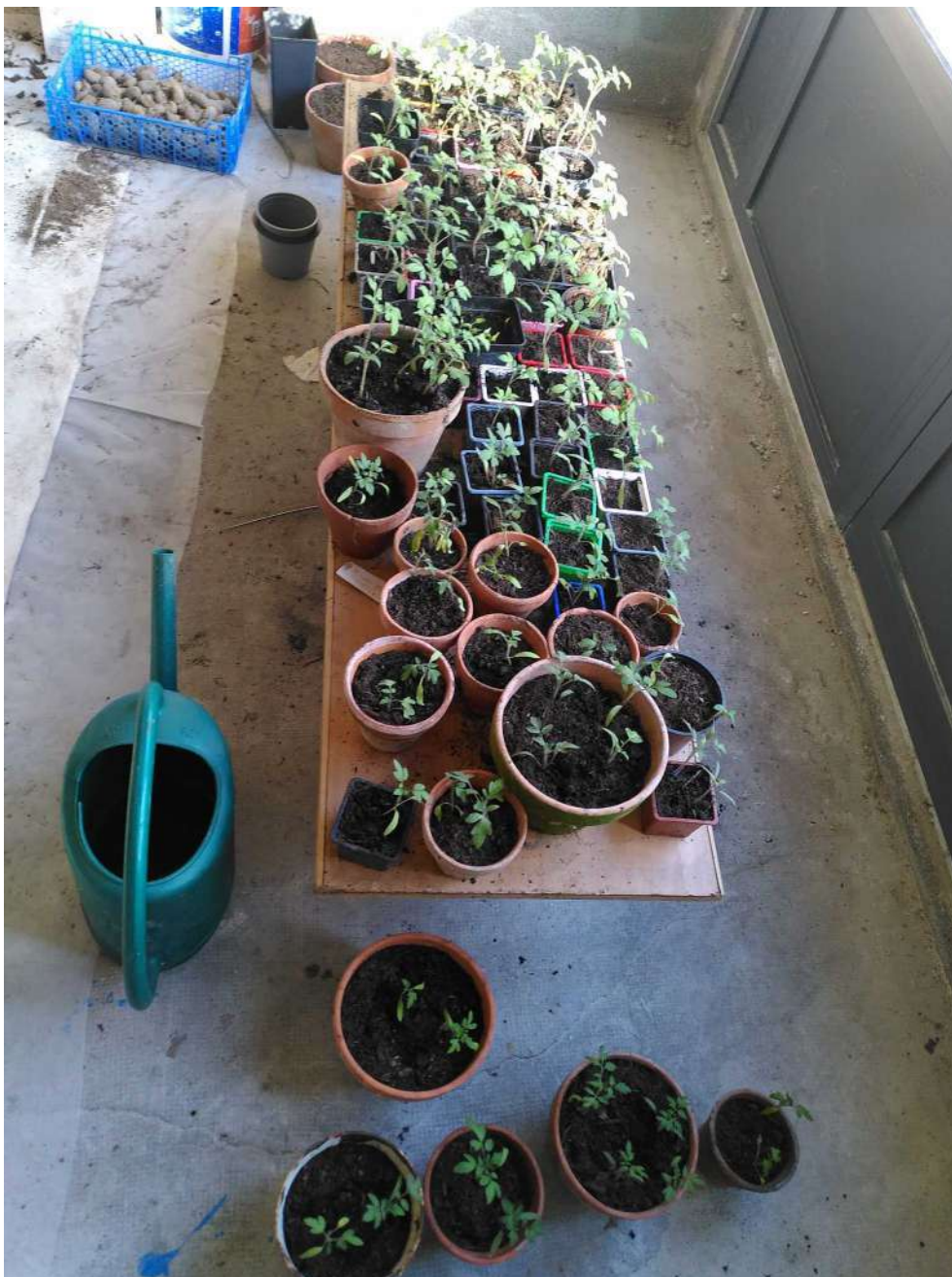
[... et petites pousses de tomates et piments veillées par des patates et un arrosoir]