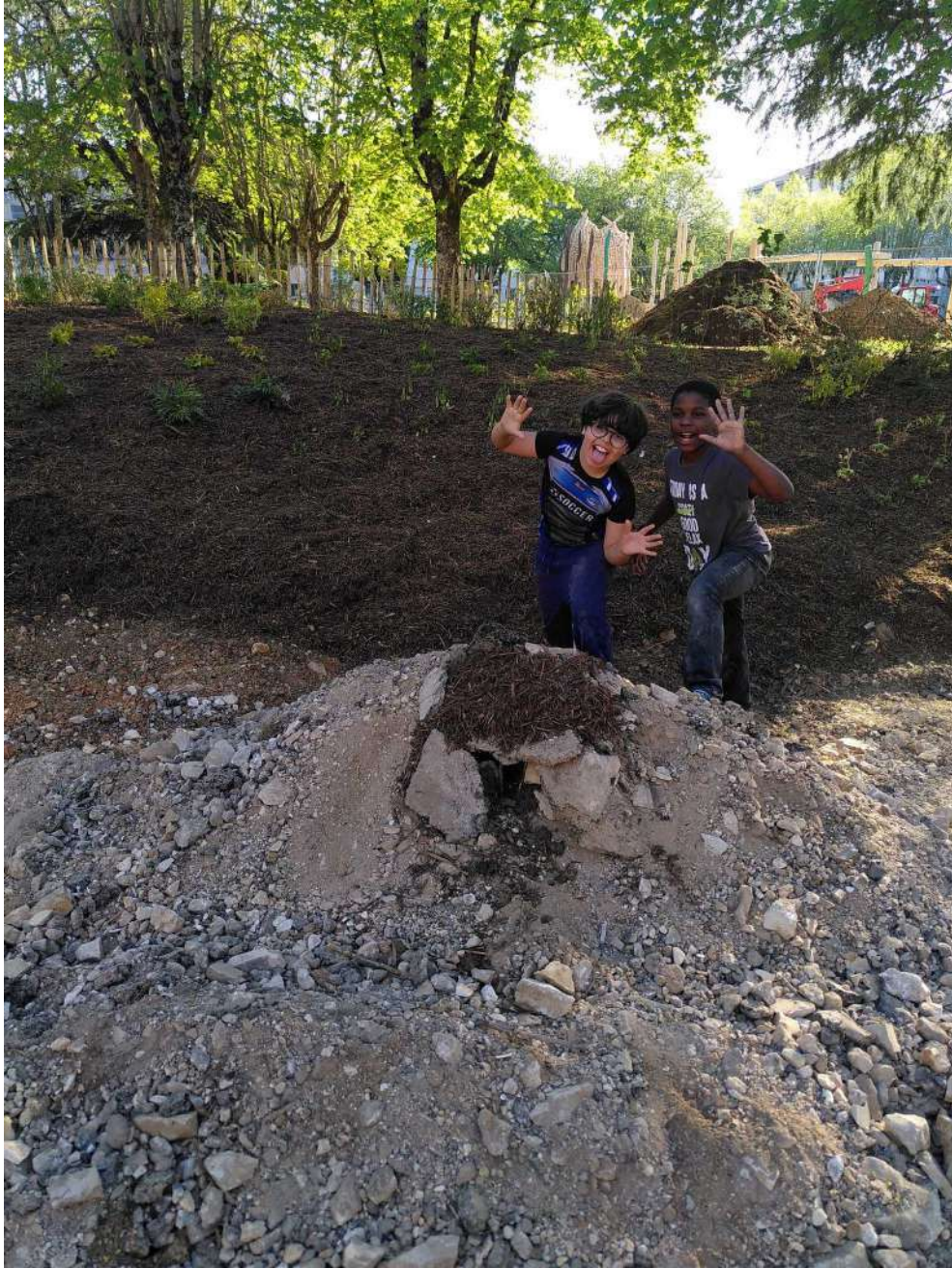
[grotte manuelle de petits d'hommes dans un jour détendu]