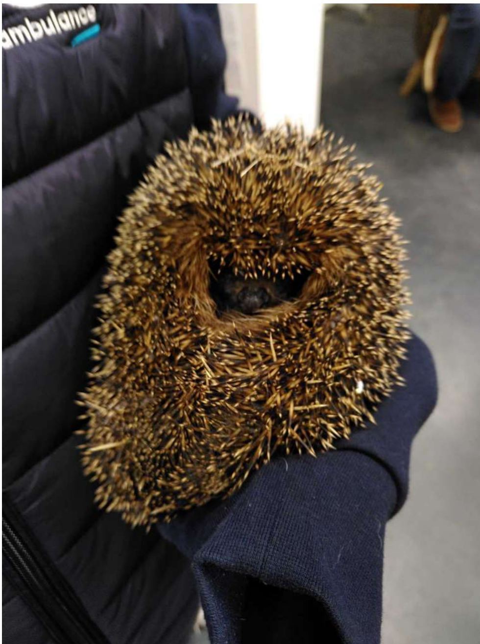
[ambulance filiale : bercer les épines]