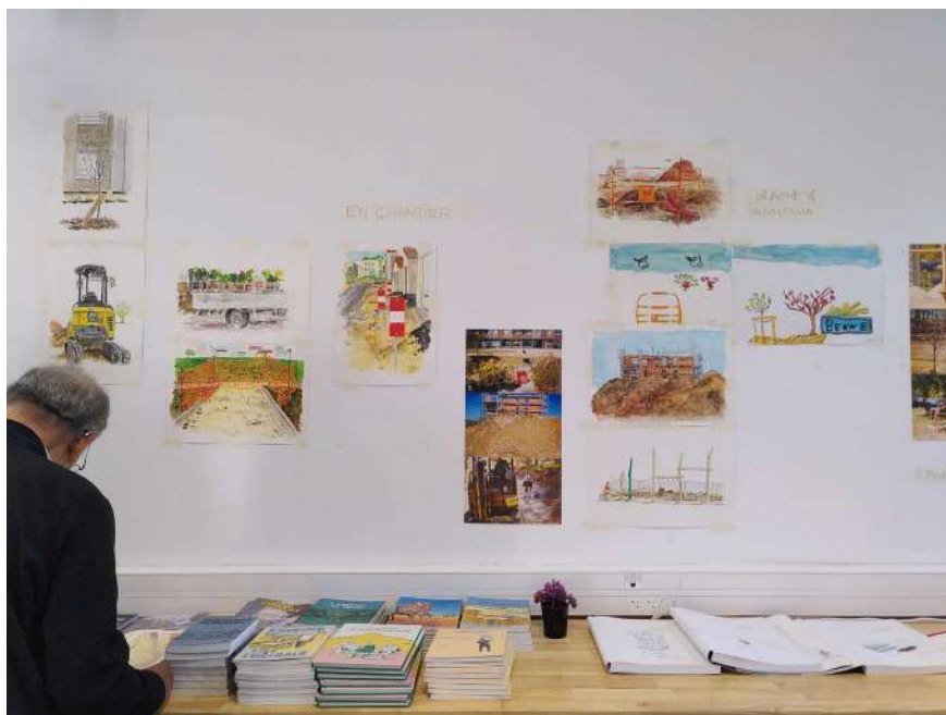
[Marvin et ses toiles d'émotions en face de l'expo de Placid En chantier ]