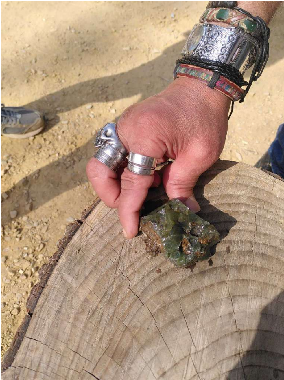
[la main de Yazin sur la malachite d'Ivan qui est une chute de fonderie du quartier]