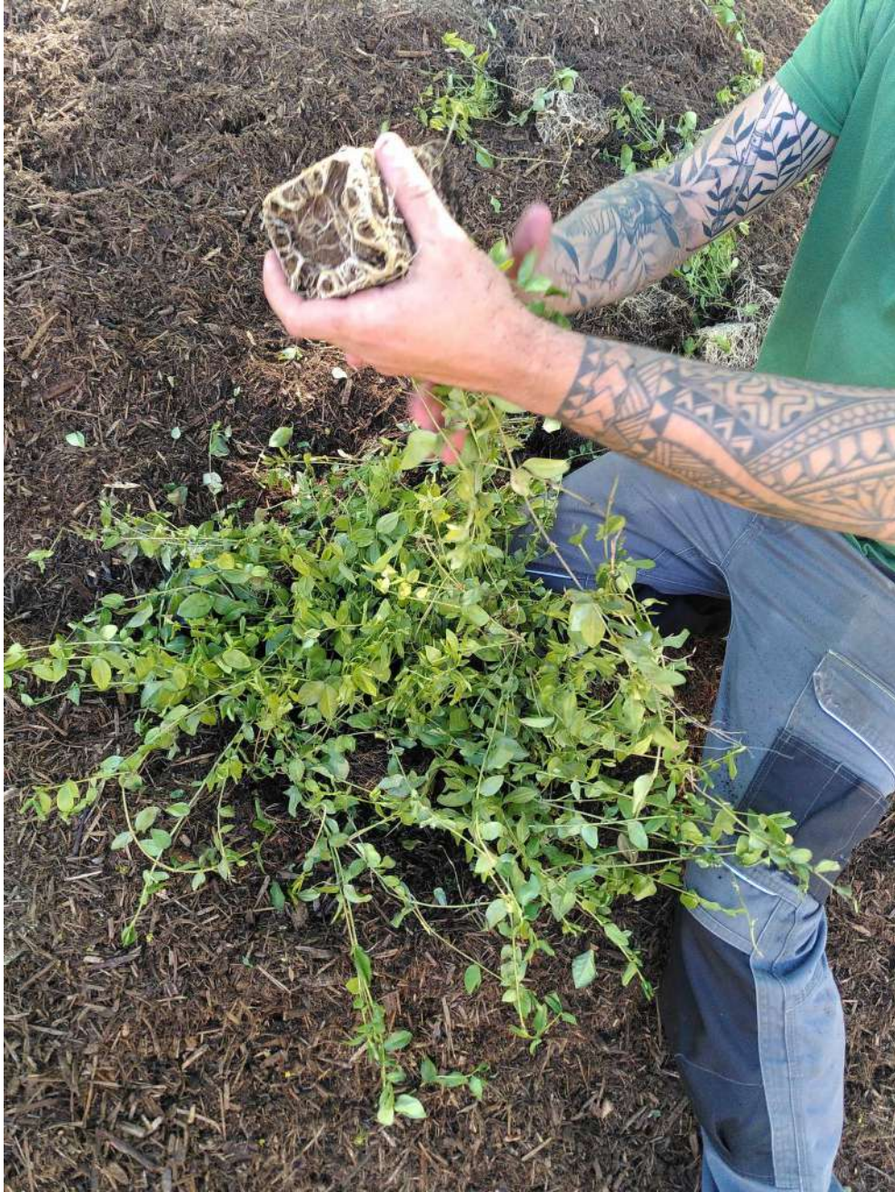
[les bras de Théo qui démêle les plants des 5000 prévus]