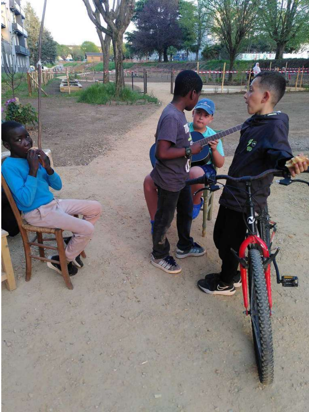
[guitare saucisse vélo sont la France de ce soir]