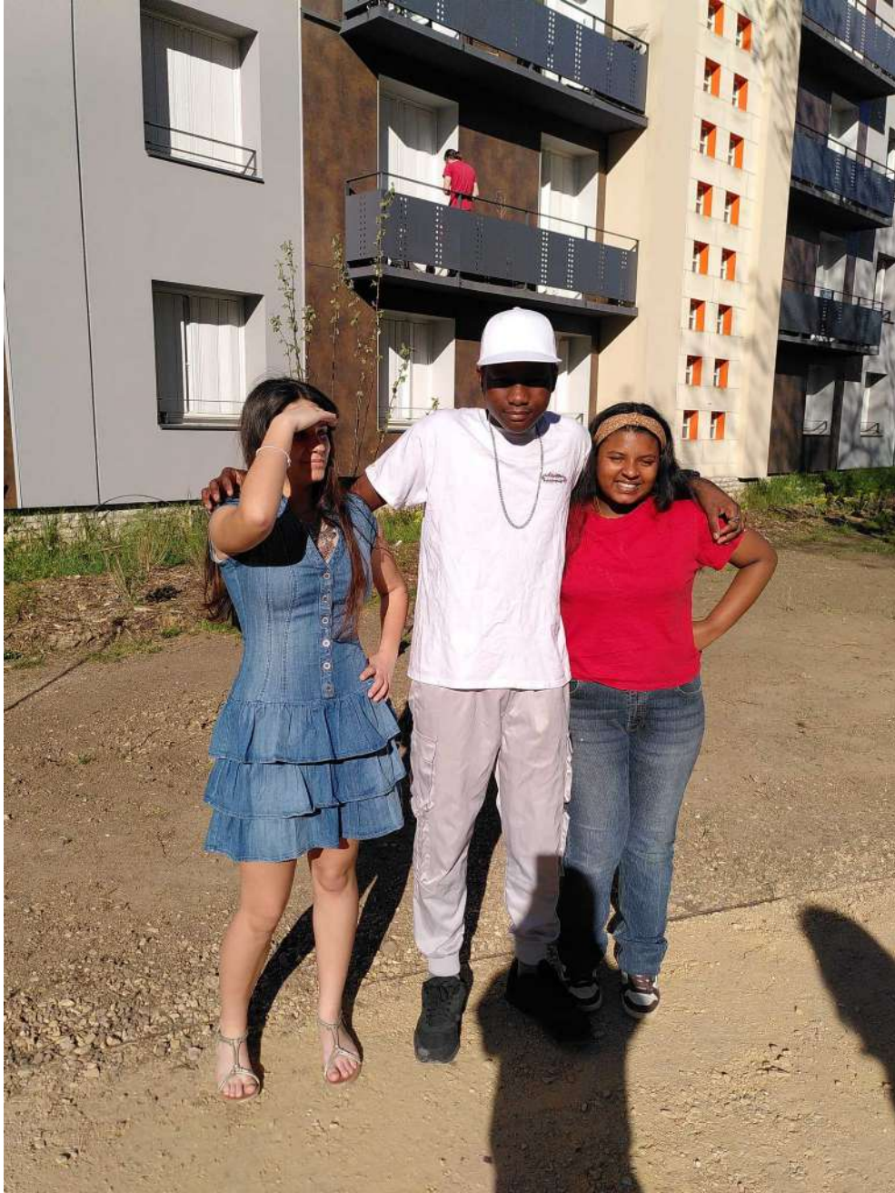
[Amélie Valério Sanyaa sont la France réelle]