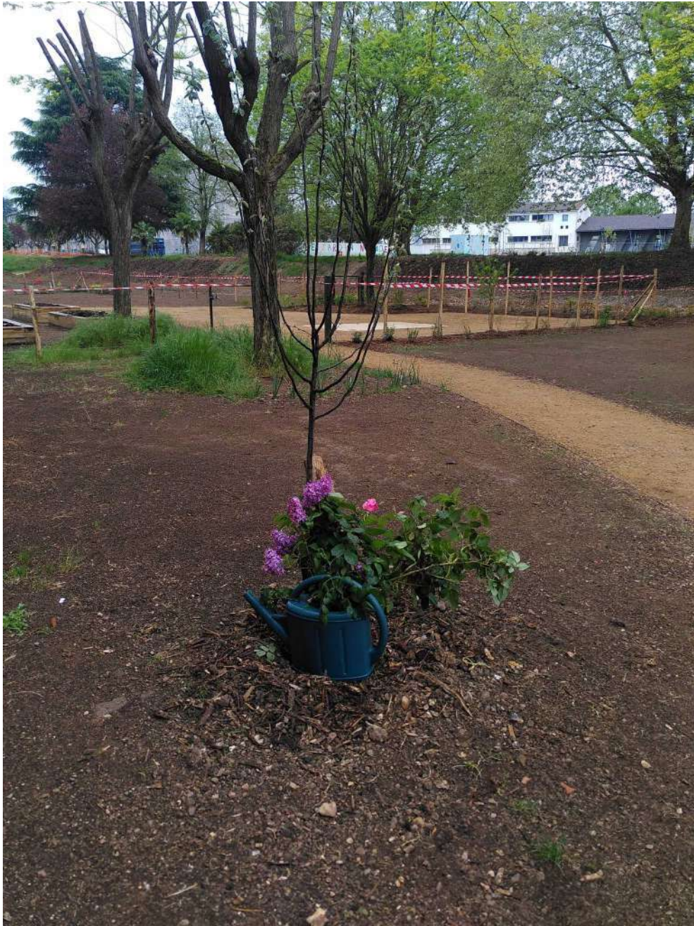
[au matin le bouquet de Christine de roses et lilas, puisqu'il faudra bien arroser]