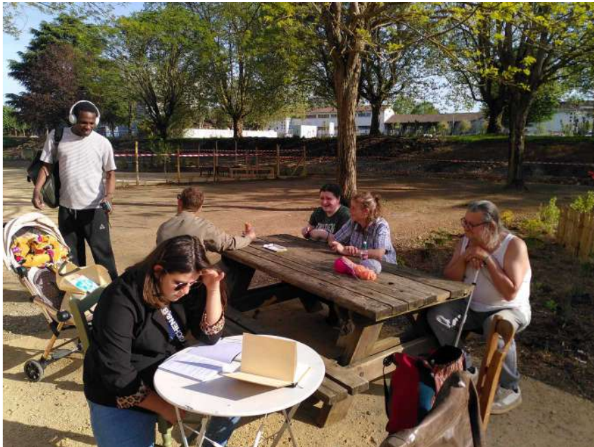
[au loin l'aire de jeux à interdictions et de près on lit lie à Forêt-Chantier Centre ]