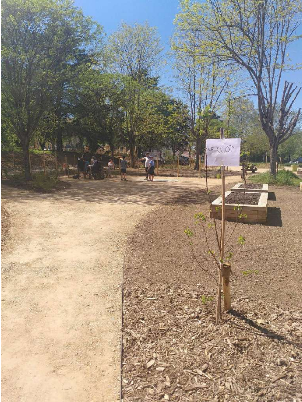
[arrêt de bus Le Clôt en pleine action de tournage live ]