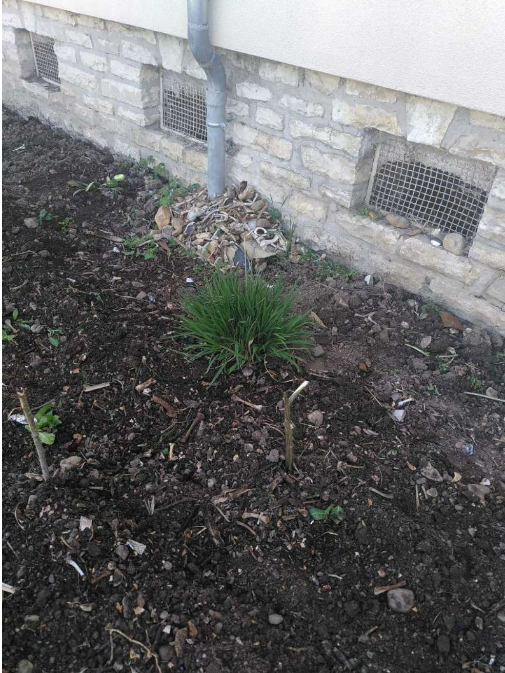
[pendant ce temps c'est l'ossuaire de Douaumont d'un parterre au pied des entrées]