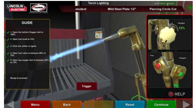
正しいトーチ設定