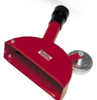
UNM 多量ヒューム用ノズル [K639-6]