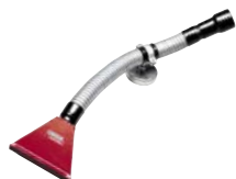
SHFA 平形吸引ノズル [K639-5]