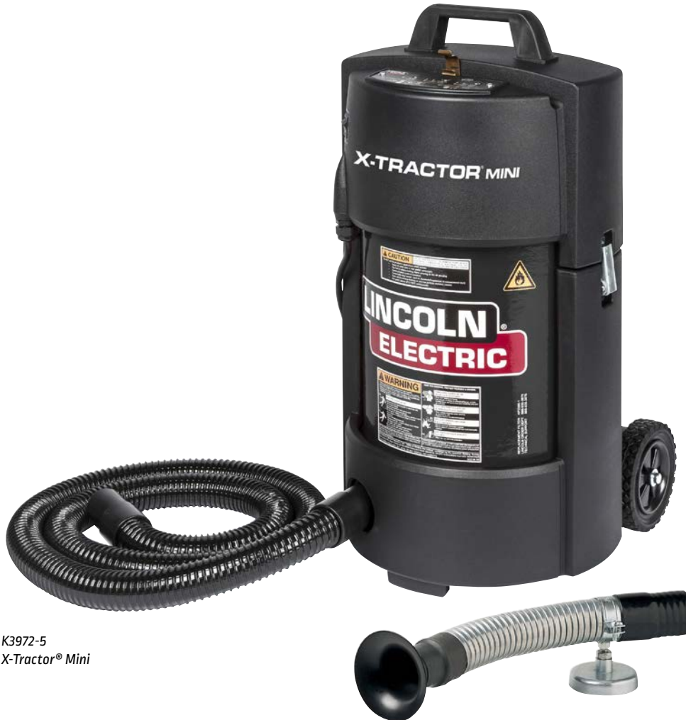
K3972-5 X-Tractor ® Mini