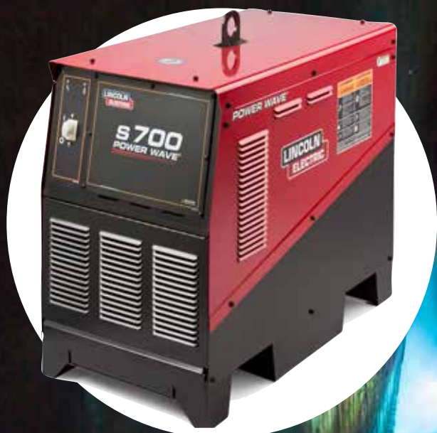
Power Wave® S700