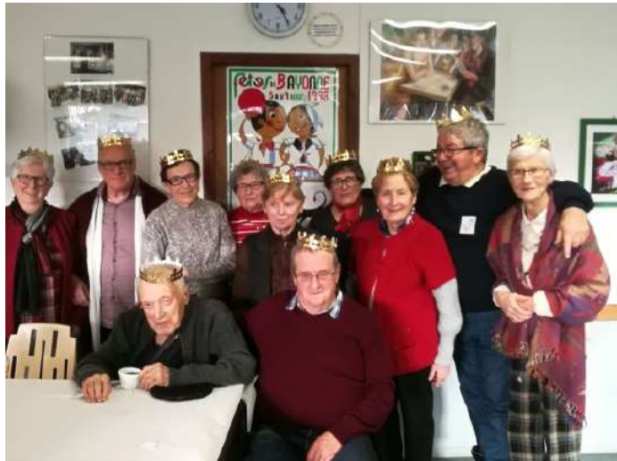
Les Reines et Rois du jour.

Les ingrédients eux sont inchangés, cidre, vin blanc, chocolat chaud, frangipanes, galettes de rois, clémentines. Bonne humeur générale autour de nos têtes couronnées éphémères. Séparément ou ensemble, quelques chanteurs des Chœur Hommes et Chorale mixte ont apporté la touche musicale accompagnée par notre fidèle Beñat au clavier, quelques pas de danse ont même été esquivés.