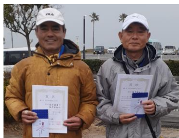
第3位 窪田・坂中ペア