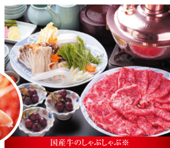
国産牛のしゃぶしゃぶ※

※冬季蟹食べ放題バイキングプランは飲み放題付きで7,000円~(補助券利用時)となります。※しゃぶしゃぶはケータリングとなります。わんわんパラダイスコテージでのご提供となります。