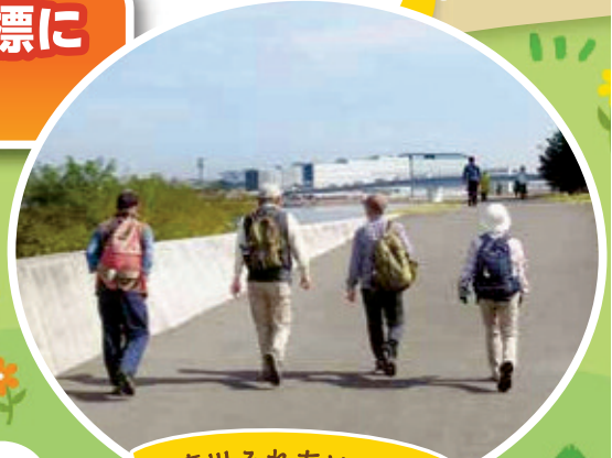
多摩川ふれあいロード