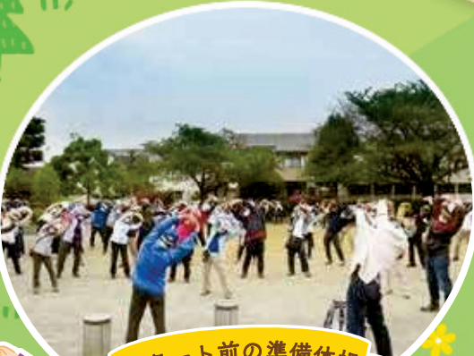
スタート前の準備体操