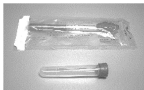
←HPV ウィルス検診器具 子宮腔・頸部の細胞を専用の器具 で自己採取します

子宮頸がんになるまでに通常数年から 10 年以上かかりますので、早期に発見し治療することが可能です。