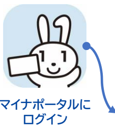
マイナポータルに ログイン