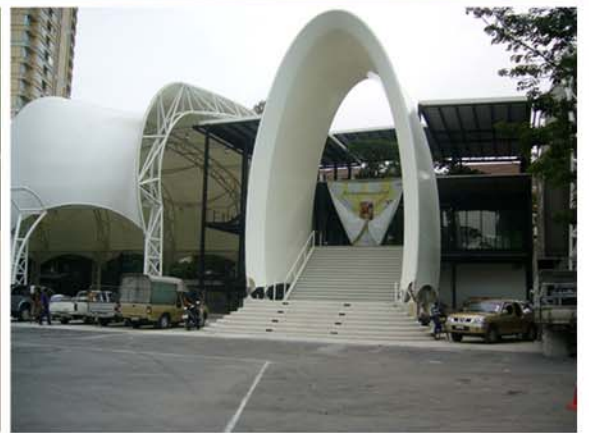
ARI FOOTBALL CONCEPT STORE