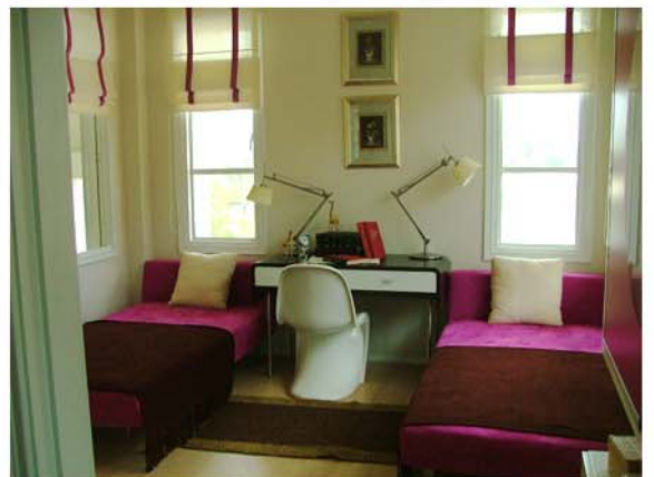
THE CITY MOCK-UP ROOM : PINKLAO