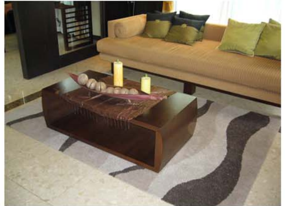
NUSASIRI RESIDENCE : BANGPLEE