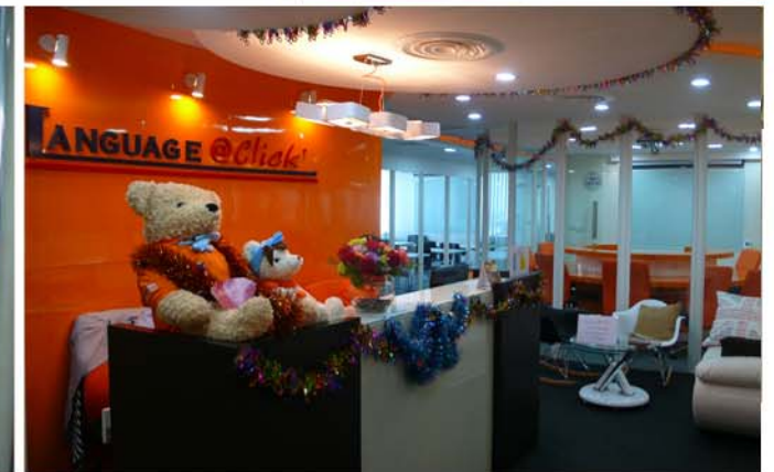
LANGUAGE @ CLICK , CENTRAL PLAZA LADPRAO