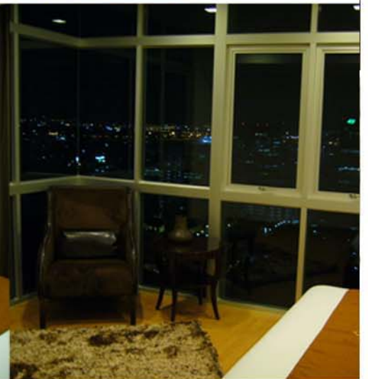
NUSASIRI ROOM TYPE C-22