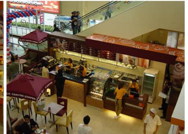
BLACK CANYON, BANG PHI