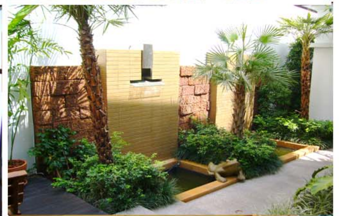
K JEW'S RESIDENCE : BANGPLUD