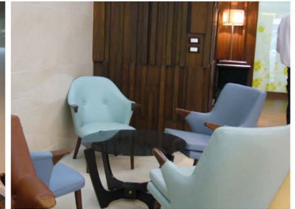
DDS DENTAL CLINIC