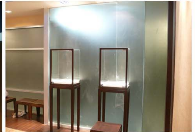
K. SAVAT JEWELRY SHOP, THONGLOR 13