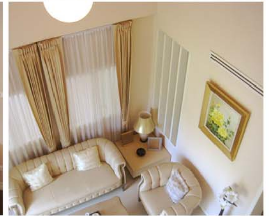
NUSASIRI MOCK-UP ROOM : BANGPLEE