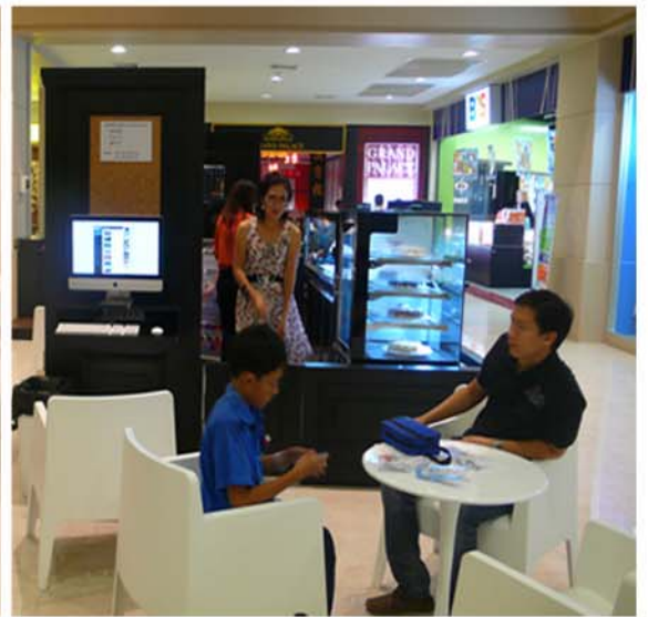
MACARONS ET MOI SHOP ,THE CRYSTAL PARK