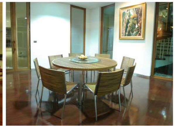
K SOMBUD'S RESIDENCE