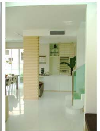
THE CITY MOCK-UP ROOM : PINKLAO