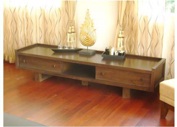
NUSA-TARA RESIDENCE : SATHORN - KANLAPAPHRUEK