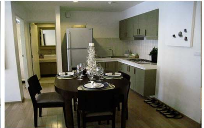
BANN NUB KLUEN RESIDENCE