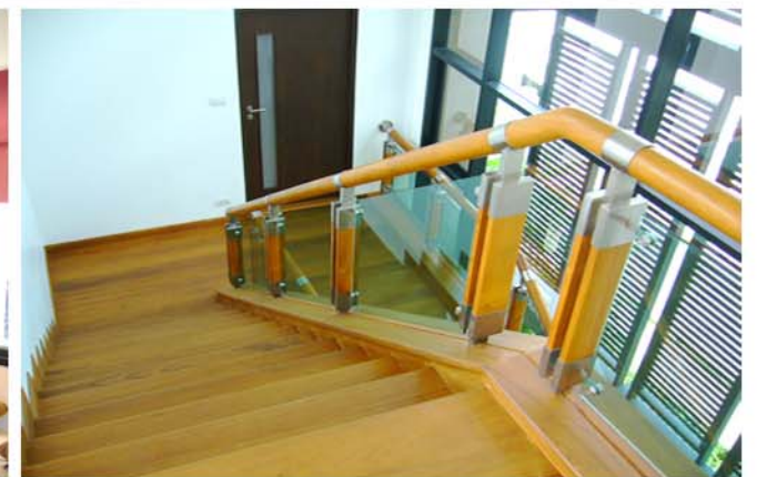
K JEW'S RESIDENCE : BANGPLUD