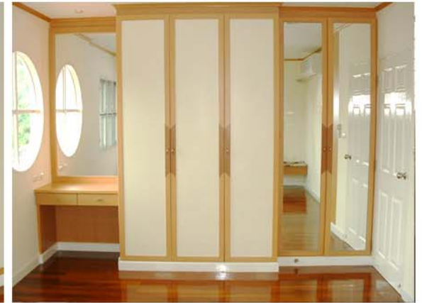
CHAIYAPROUG RESIDENCE : BANG-BUATONG