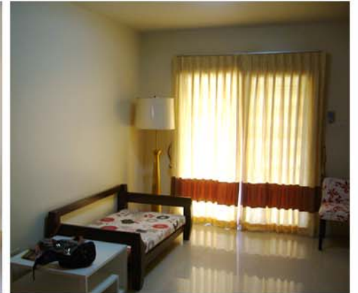
KLONG - 2 RESIDENCE : PATUMTHANI