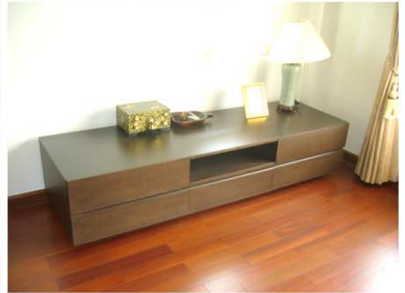
NUSA-TARA RESIDENCE : SATHORN - KANLAPAPHRUEK