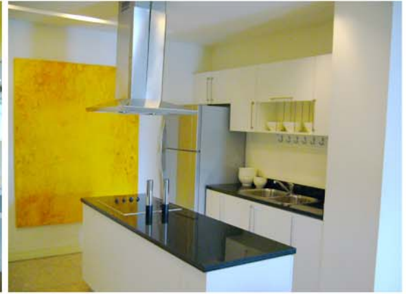
NUSASIRI MOCK-UP ROOM