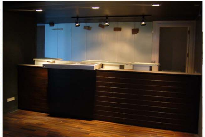
NUSASIRI OFFICE 16