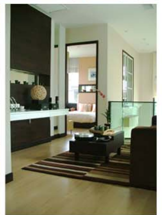
THE CITY MOCK-UP ROOM : PINKLAO