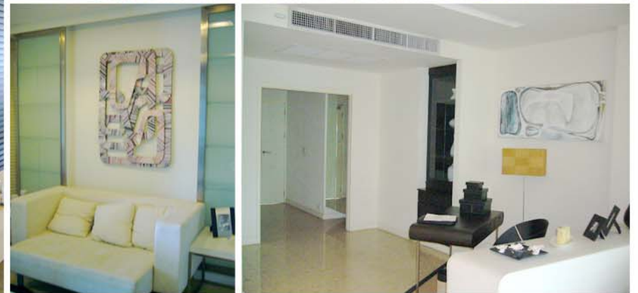
NUSASIRI MOCK-UP ROOM