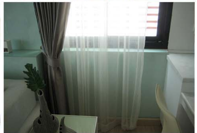
BANN PHUPHA-TARA CONDO , ROYONG