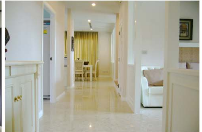
NUSASIRI RESIDENCE : BANGPLEE