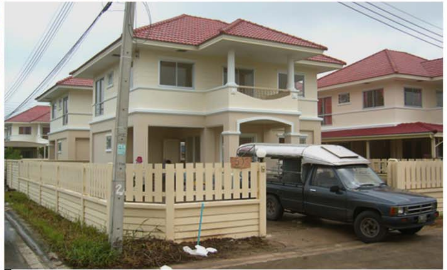
PREMPRI RESIDENCE ,RANGSIT