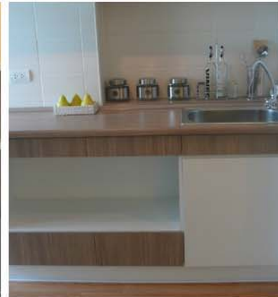
K. SANPETCH ROOM , CONDO