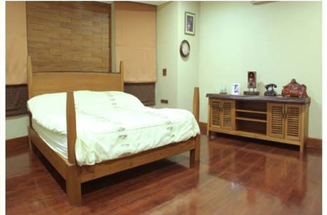
K SOMBUD'S RESIDENCE