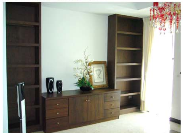
NUSASIRI RESIDENCE : BANGPLEE