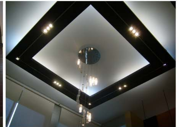
K.SAVAT JEWELRY SHOP, SILOM