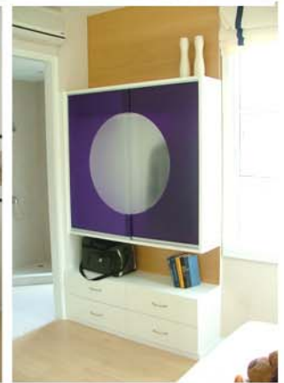
THE CITY MOCK-UP ROOM : PINKLAO