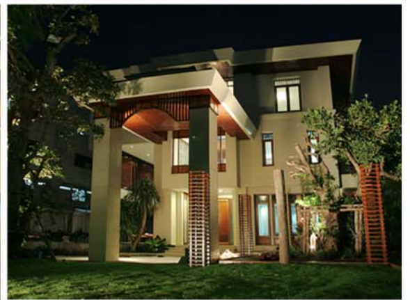
K. SOMBAT RESIDENCE