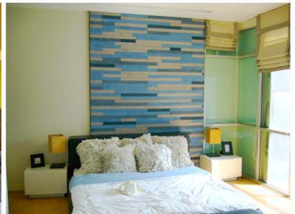
NUSASIRI MOCK-UP ROOM