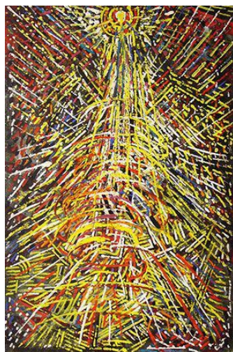
«Эйфелева башня». Середина 1980-х