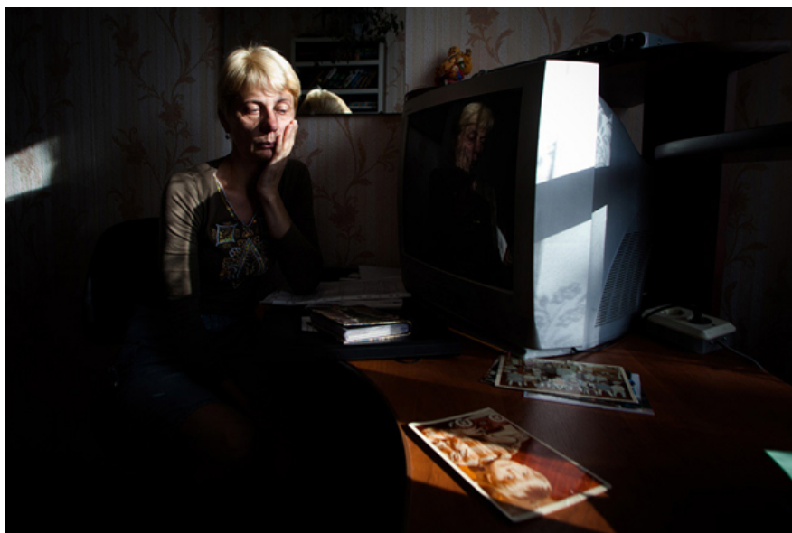
Витебск / Август 2012

Важно отметить заинтересованность администрации гомельского Дворца Румянцевых-Паскевичей в презентации современного искусства. Это доказывает другой экспозиционный проект, открытый во Дворце незадолго до «Дворцового комплекса», — часть грандиозной инсталляции «Алтарь наций» украинской художницы Оксаны Мась. Инсталляция Оксаны Мась стала одним из номинантов на лучшую работу 54-й биеннале в Венеции. По версии журнала Art Investor, арт-объект вошел в число лучших женских проектов престижной международной венецианской выставки.