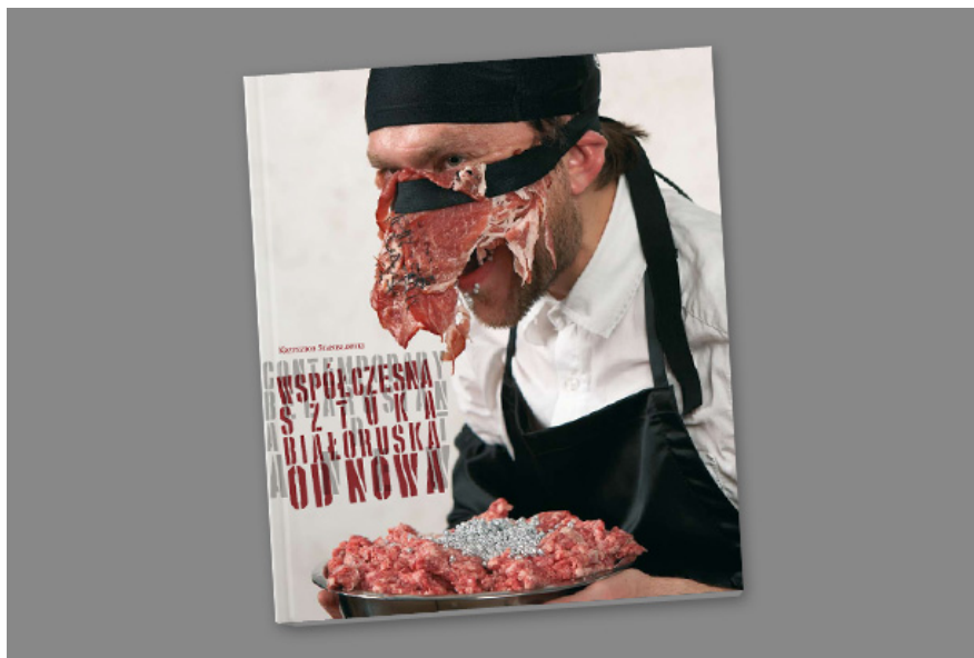
© Krzysztof Stanislawski / "Współczesna sztuka białoruska ODNOWA" / 2012

Коновалова. С победителями других номинаций можно ознакомиться здесь . Тем временем в Вильнюсе состоялась выставка финалистов конкурса «Пресс-фото Беларуси-2012». Мероприятие прошло в рамках проекта «Белорусская весна в Вильне» при поддержке молодежной ассоциации «StudAlliance».