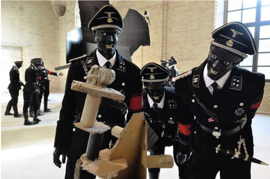
Фрагмент инсталляции Джейка и Диноса Чепмен «The Almighty Disappointment»

Центр современной культуры «Гараж» и издательство «Ad Marginem» объявили о запуске совместной программы по изданию книг о современной культуре. В новую серию войдут издания о современном искусстве и архитектуре, новых медиа и фотографии, кинематографе и театре, социологии и маркетинге культуры. В них разместятся работы Жюль Делеза и Ролана Барта, произведения, которые впервые выходят на английском в 2012 году, например, книга Джонатана Литтелла «Как смотреть на Фрэнсиса Бэкона». Напомним, что Центр современной культуры «Гараж» — международная некоммерческая институция, основанная Дарьей Жуковой в 2008 году. Ее целями являются развитие и популяризация современной культуры.