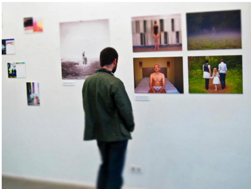
Репортаж с открытия Artes Liberales

Выставка Константина Селиханова в музее Азгура, проект «Дворцовый комплекс» в Гомеле, выставка «Радиус нуля. Онтология арт-нулевых» на заводе Горизонт, «Всебелорусская выставка современного искусства», которую планируют провести в павильоне БелЭкспо в этом году, — эти последние проекты остро демонстрируют поиск площадок для презентации современного искусства, которых так не хватает в Беларуси. Журнал «Мастацтва» также инициировал опрос по поводу необходимости появления в Минске новой арт-площадки, в котором приняли участие современные белорусские художники, кураторы и искусствоведы. Но, возможно, в скором времени в Минске появиться арт-депо (?). Стало известно, что сейчас ведется поиск площадки для этого «многофункционального культурного центра современных искусств». Министерство культуры занимается поиском невостребованного производственного помещения, которое реально приспособить под арт-депо, где смогут работать молодые художники, скульпторы, архитекторы, дизайнеры, будут проходить выставки, мастер-классы.