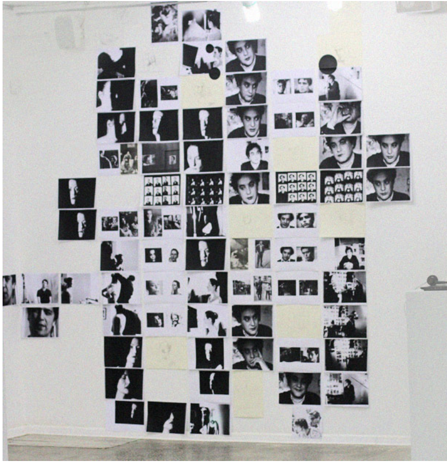
Мона Яс / "Плеяды"

Кроме выставки художественных работ проект содержал обзорную лекцию немецкого искусствоведа Вибке Беренс о галерейной жизни Германии, презентацию немецкого актуального искусства. Важным пунктом программы стал круглый стол участников проекта со зрителем в галерейном пространстве, открытые диалоги, а также посещение участниками проекта выставочных площадок и других культурных учреждений Беларуси с целью ознакомления с культурной ситуацией страны. Планируется создание каталога и документального фильма о проекте.