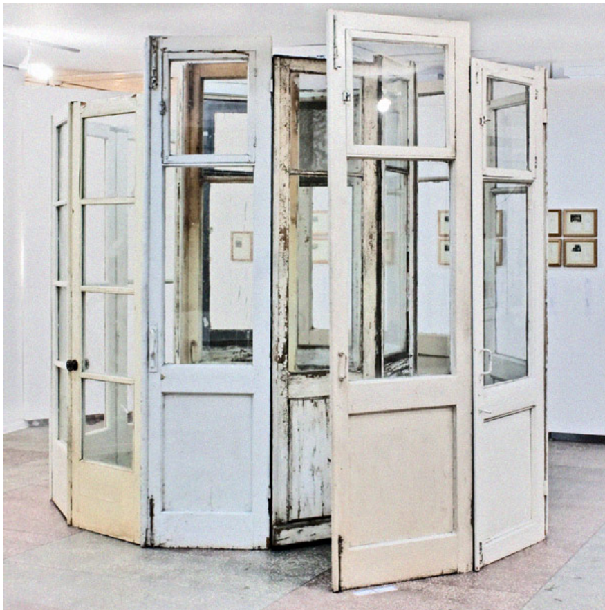
Даниэль Сегенберг / 2010

Основная тема выставки — рассуждение об аспекте актуального как о временной категории. В мировой практике художники часто создают разовые инсталляции (как, например, работа Даниэля Сегенберга, которую художник создал непосредственно в Минске и которая «исчезнет» сразу после окончания выставки). Художники прямо указывали на временной промежуток в содержании своих работ, будь то документация диалога с городским таксистом (акция Александра Комарова) или размышление о сохранении объектов искусства в наши дни. В экспозиции «Visual Arts. New Practices» представлены фотоисследования, тексты, инсталляции, видеодокументация перформансов, арт-объекты.