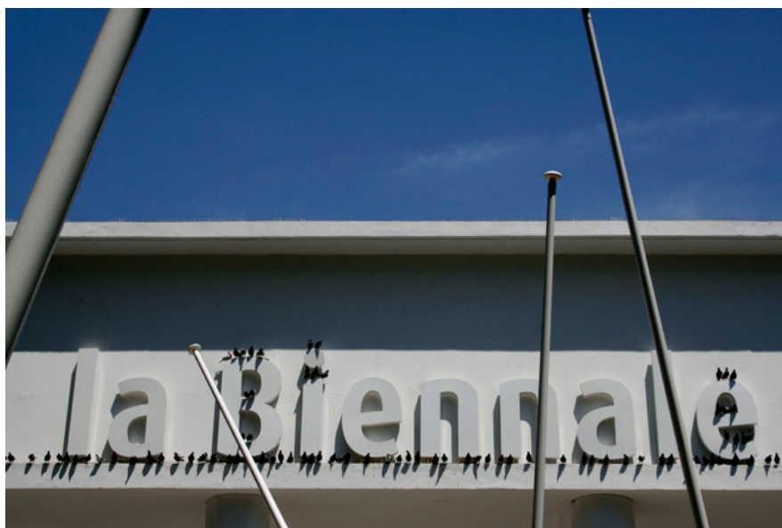
«Центральный павильон» Джардини / Maurizio Cattelan

Мы попадаем на остров очаровательных декораций театра, представление в котором закончилось лет 300 назад, занавес опущен и все только зрители. Пребывание здесь нестабильно, как вода — она основа, защита и угроза этого города, движение по ней — путь до тошноты. Камень — свидетель героических побед — лишь пребывает в ожидании последнего слова стихии. История сыграла злую шутку. Отвоеванное у природы и мира проиграло времени, здесь оно остановилось. Венеции в этом смысле не повезло — даже авиация союзников не освободила площадей для будущего роста, окончательно превратив город в музей, падение которого к ногам романтического варвара-туриста было бы необратимо, не овладей художники военной терминологией. Авангард искусства нашёл себе гавань в столице смерти. Остров идеи нового на острове традиции искусства в море островов культур старого мира.