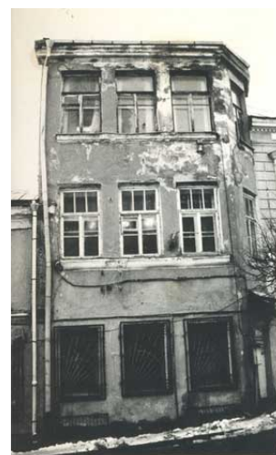
Будучая галерэя Сіма на 1-й 92