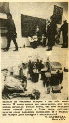
Т. ПАСТЕРНАК. Фото «НС».

состоятельного художника, но ее инициатор сослался на классическую формулу: Запад поможет. Год назад Пушкин обратился к знакомым белорусам из Америки, и те с готовностью согласились стать его меценатами.