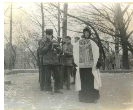
Перформанс «ВІЛІАМ СЬВЯТОГА ЯЗЯКОРА»