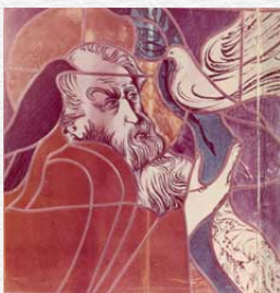
Літэратура і Мастацтва, 1992 г.

Но нет здесь скуки, так что никому зевать не приходится.