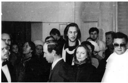
Можно привести несколько названий работ разных размеров и жанров: