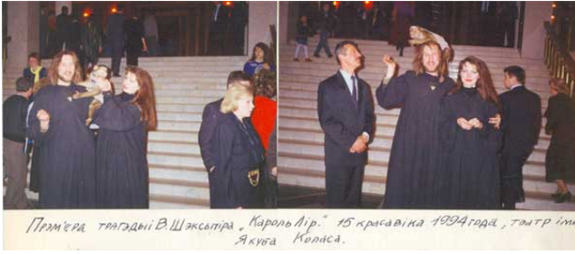
Прем'єра тэатрады «В.Шэкспіра „Кароль Лір“» 15 красавіка 1994 года, тэатр імя Я.Купалы.