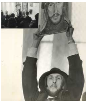
Свабода, красавік 1992 г.