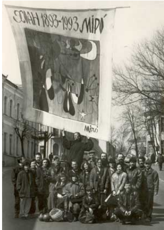
ЛІТАРАТУРА і МАСТАЦТВА, 24. IX. 94