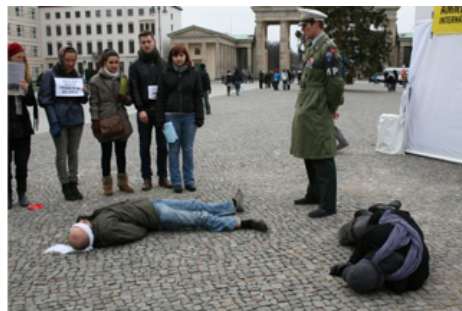
Video screenings at Paris Square in Berlin // Protest against death penalty in Belarus with support of Amnesty International / 19.12.2011

По ее словам, первый номер «Белорусского самоуправления» был принят населением страны, так как многим читателям нравится нестандартный жанр газеты.