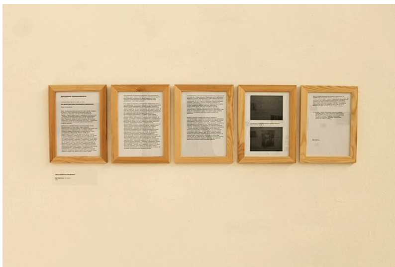
Праца Ігара Саўчанкі «Дапущэнне Кшыжаноўскага» / выстава «Anatomia. Ідэальнае цела», Менск 2015

«З'яўляемся мы толькі спосабам фармавання гэтага канала альбо / і самой крыніцай сігналу, і што там — на прыёмным баку? Як ведаць, што адкрыецца нам у адказах на гэтыя пытанні ці нават на шляхах пошуку такіх адказаў?»