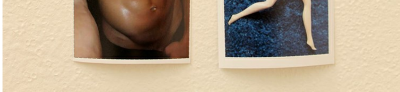
Фрагмент серыі Алены Пратасевіч «#Perfect цела (хэштэг Ідэальнае цела)» / выстава «Anatomia. Ідэальнае цела», Менск 2015

У якасці выказванняў пра ідэальнае цела, дзе выразна прагаворваюцца канцэптуальныя аспекты дадзенай праблемы, неабходна адзначыць два найцікавейшыя праекты класікаў беларускай фатаграфіі — Сяргея Кажамякіна («У пошуках іdeal body») ды Ігара Саўчанкі («Дапущэнне Кшыжаноўскага»). Першы спалучае ў сабе візуальны матэрыял і элементы інсталяцыі — выпуклыя літары шрыфту Брайля, замяніўшы якімі звычайнае «бачанне ідэальнасці», аўтар прапануе глядачу самастойна адказаць на пытанні: «Ці любая бачнасць выклікае давер... Ці можам мы растлумачыць, стоячы перад карцінамі, скульптурамі і фатаграфіямі, якія дэманструюць прыкрасаныя, ідэалізаваныя, а часам і знявечаныя целы, чаму мы так упарта іх выўляем?» Прымаючы прапанаваныя фатаграфам правільны гульні, мы здольныя паспрабаваць пераасэнсаваць папулярныя ўяўленні пра прыгажосць і ідэальнасць (выпадкава ці не, але ў той жа зале, якая за нашай спінай, знаходзяцца серыі Андрэя Карачуна і Алены Пратасевіч), задзейнічаючы ў іх пазнанні тактыльныя адчуванні.