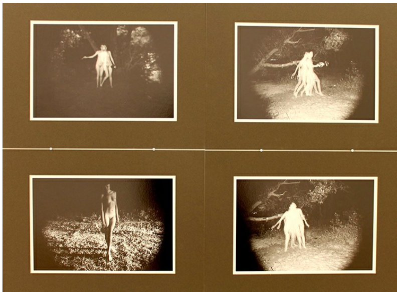
Фрагмент серыі Андрэя Карачуна «Некаторыя практыкі асэнсавання цела» / выстава «Анатомія. Ідэальнае цела», Менск 2015

У гэтым сэнсе, сыходзячы з размежавання, прапанаванага выбітным французскім даследчыкам Андрэ Рюе , фотапраекты «Анатоміі-3» можна ўмоўна падзяліць на дзве групы. Тыя, дзе фатаграфія ўсё яшчэ выступае ў якасці састарэлай сёння «фатаграфіі-дакумента», і тыя, дзе яна прадстаўляе іншыя, «абыходныя» шляхі доступу да рэчаў, фактаў і падзеяў: пераходзячы ад «калькі [рэальнасці] да малы, ад ідэалу праўды і блізкасці да бясконай гульні аддалення і дыстанцыі» [1]. У першую групу, на жаль, трапляе пакуль большая колькасць прац — такіх, дзе глядачу прапануецца разам з аўтарамі фота атрымаць асалоду ад літаральнага чытання паняцця «ідэальнасці», гэта значыць разглядаць здымкі ідэальных аголеных целаў. У пераважнай большасці, натуральна, жаночых і юных. І калі прысутнасць у экспазіцыі натуралістычных прац класіка польскай фатаграфіі Збігнева Длубака , выкананых у 1970-1974 гады, можна растлумачыць жаданнем куратаркі найбольш поўна, у эвалюцыі, прадставіць заяўленую тэму, то прычыны звароту да сінамічнай і сёння абсалютна не актуальнай візуальнай мове ў работах сучаснага маладога аўтара Андрэя Карачуна незразумелыя. «Асэнсаванія цела», заяўленага ў назве праекта, так і не адбылося.