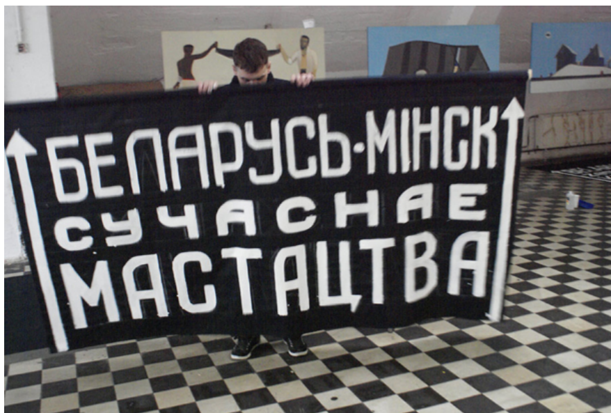
Митрич / белорусская акция в Тахелесе

Белорусский перформансист Митрич (Дмитрий Юркевич) рассказывает о том, что такое «Тахелес».