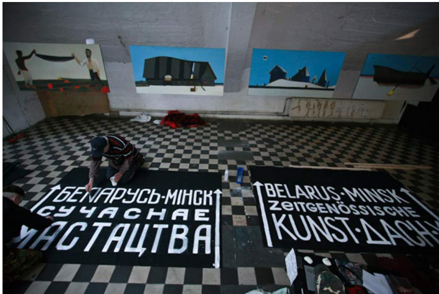
Белорусская акция в Тахелесе

Что особенного в «Тахелесе»? Зачем он нужен белорусским художникам?