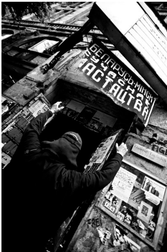
Белорусская акция в Тахелесе

Наверное, можно поставить вопрос немного иначе. Зачем мы ему нужны, например. «Тахелес» питается нашей энергией. В ответ он дает нам возможность разогнать свои замыслы на полную катушку. Тут царит ощущение полной творческой свободы. Ограничением может служить только граница нашего воображения. Такое себе трудно, просто невозможно представить, не побывав тут! Не пожив тут.