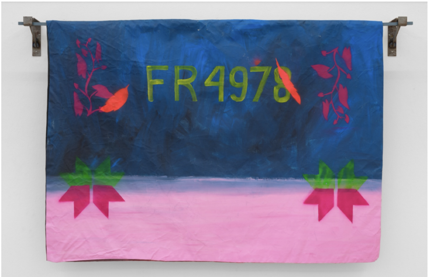
Марына Напрушкіна. FR4978. Палатно, акрыл. 2023.

Супрэматычныя кампазіцыі руйнуюць плаўнае апавяданне, звязанае з наіўным мастацтвам «маляванак», ператвараючы выставу ў трывожную гісторыю, у цэнтры якой ляжыць аналіз эксплуатацыі жаночай працы з дапамогай практык прымусу і сістэмнага прыгнёту.