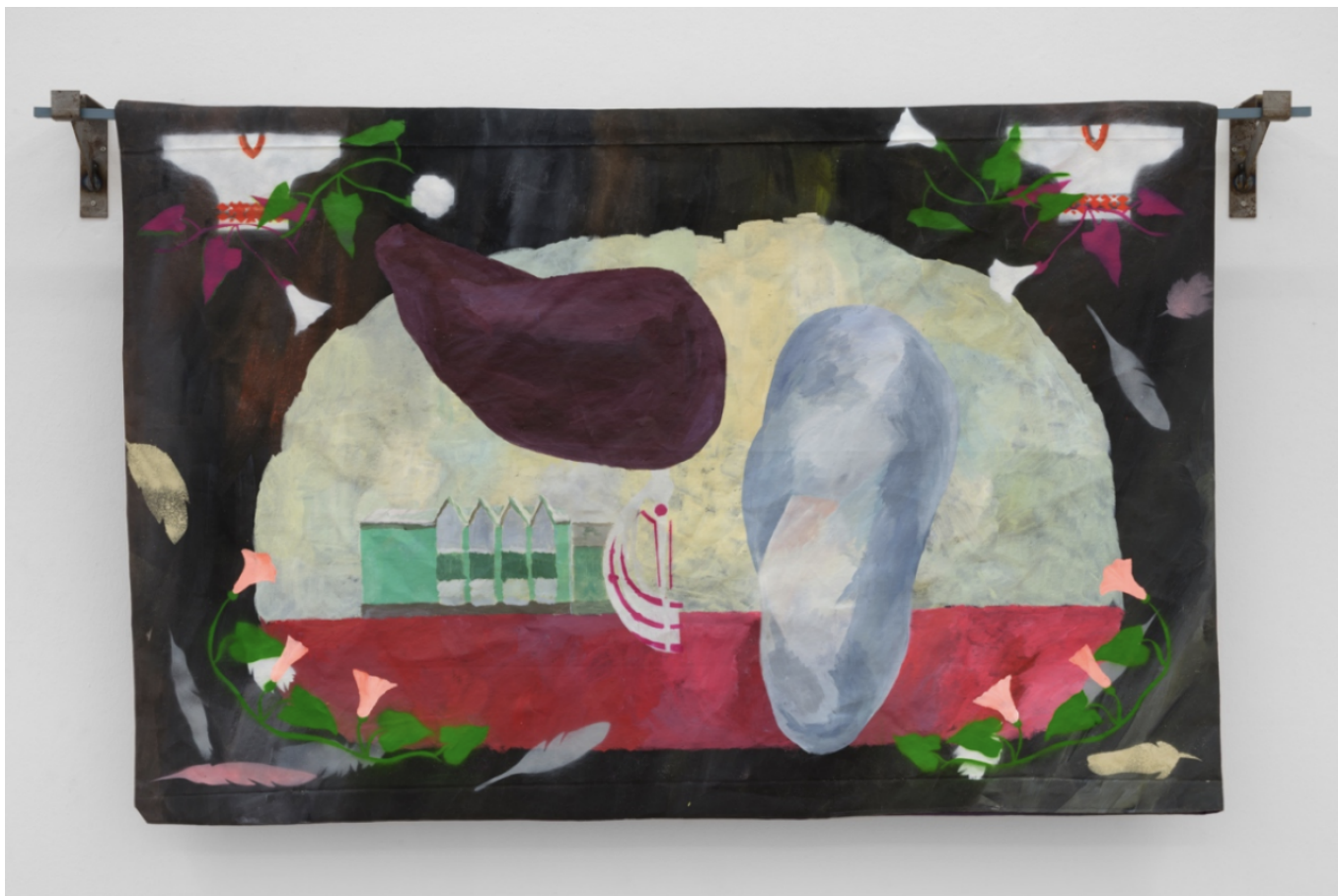
Марына Напрушкіна. Дзяржаўнае прадпрыемства № 4. Палатно, акрыл. 2023.

Сярод вырабаў, якія яны шыюць, працуючы па 10-12 гадзін у дзень, – форма для супрацоўнікаў Міністэрства ўнутраных спраў, якія здзяйсняюць гвалт у дачыненні да зняволеных і з’яўляюцца ключавой апорай рэжыму. А таксама – хакейнае форма – любімы від спорту Лукашэнкі , і сувенірная прадукцыя з вышыванкамі, за якія людзі могуць быць затрыманыя, калі іх зловяць у грамадскім месцы. Тым не менш яны там вырабляюцца і прадаюцца замежнікам.