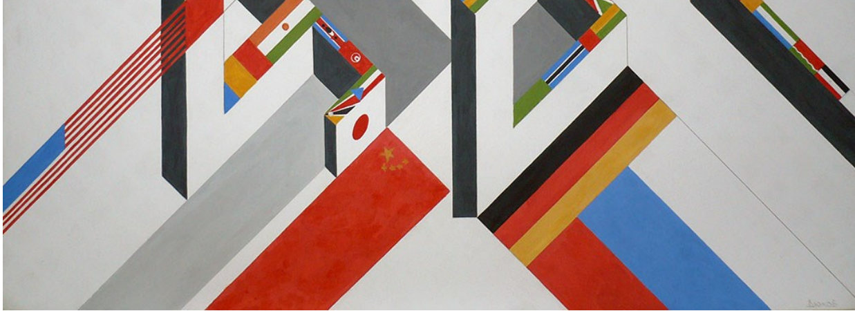
Автор работы: Дюков Д.