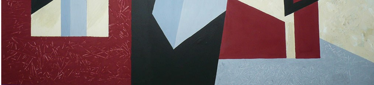
Автор работы: Ващенко Я.