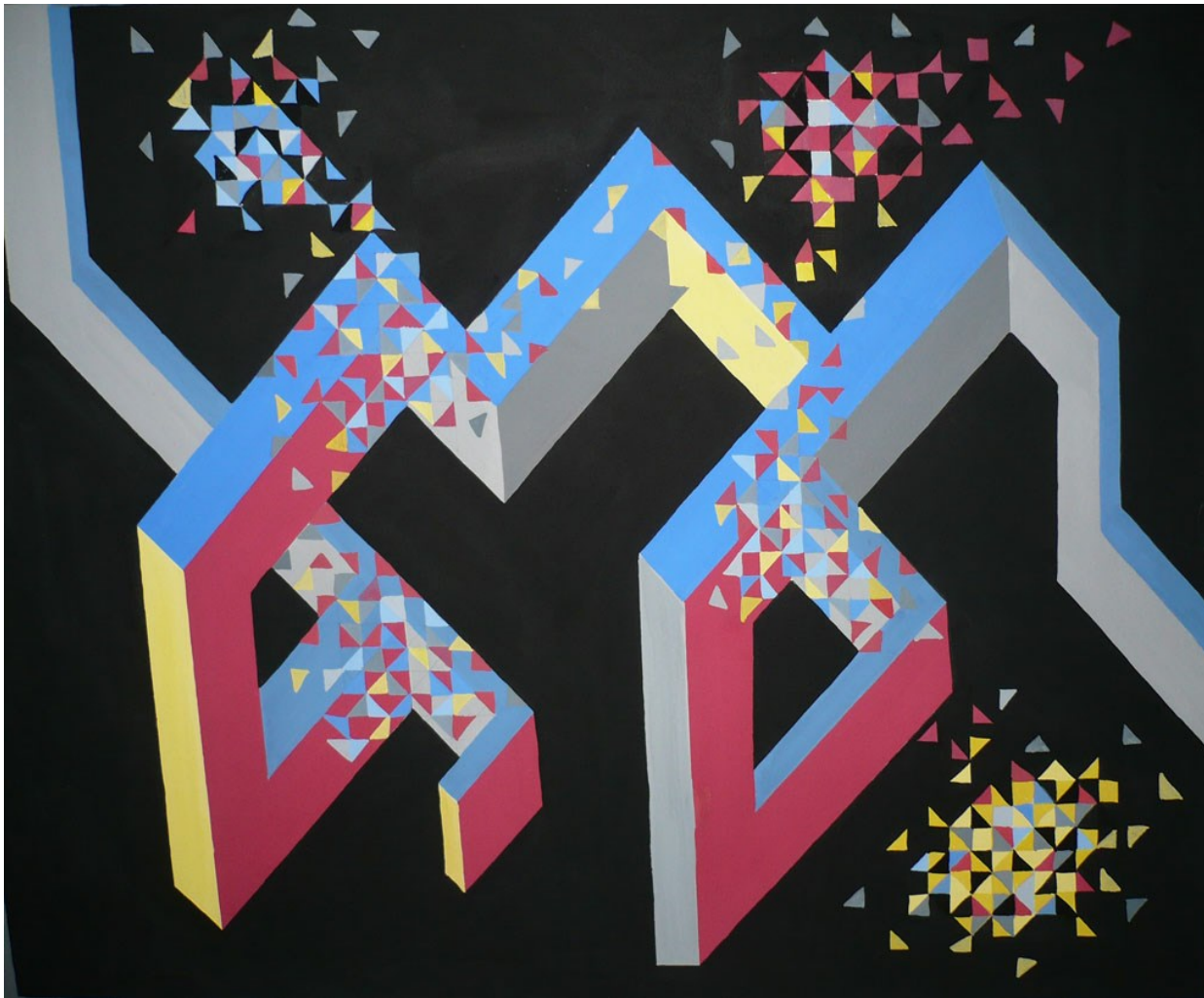
Автор работы: Гиль Ю.