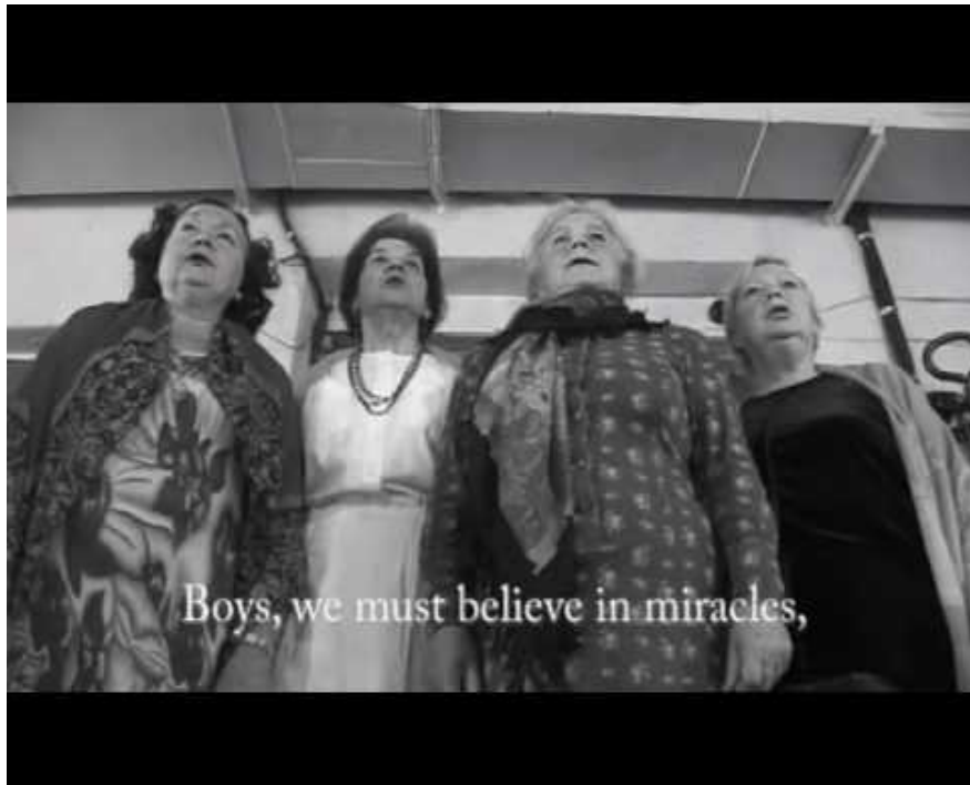
группа «Фабрика Найденных Одежд» / видео «Алые паруса»

Глюкля: И такое отношение можно увидеть у всех.