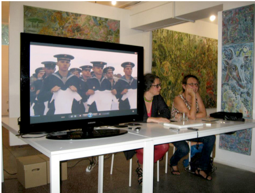
Кадр из видеопроекта "Хрупкость"

Как вы думаете, существуют ли проблемы в искусстве на локальном уровне, на уровне Петербурга?