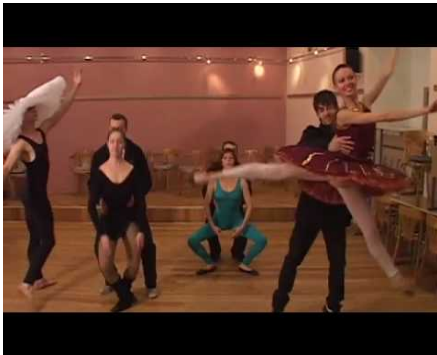
группа «Фабрика Найденных Одежд» / видео «Утопический союз безработных» / 2009

Цапля: С другой стороны, феминизм — это модели движения. Не способы борьбы, а попытка договориться. Мы не говорим о том, что женщина должна себя вести, как пацан, это нехорошо. Не надо убеждаться в том, что кто-то сильнее и правее, как в наших странах поступают: «против лома нет приема».