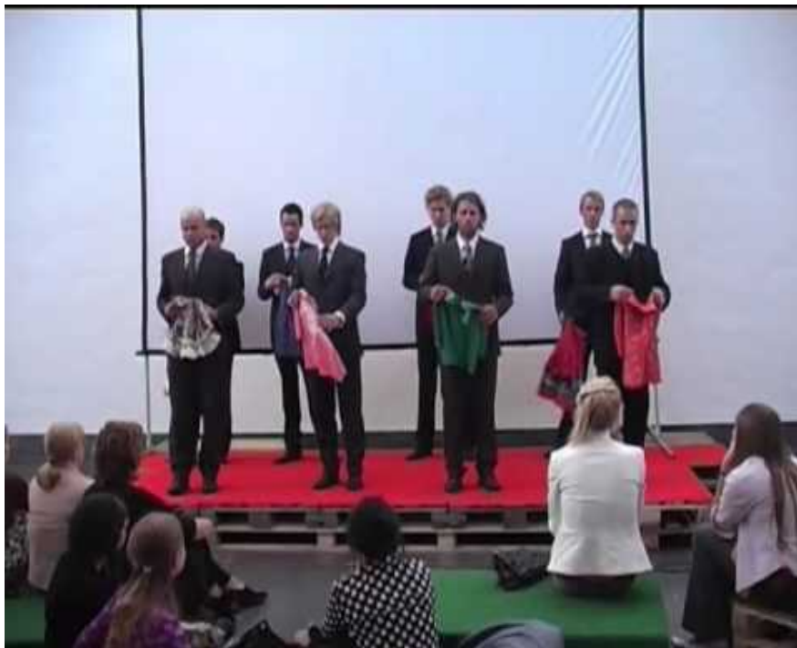
группа «Фабрика Найденных Одежд» / видео «Сад для предпринимателей» / 2004