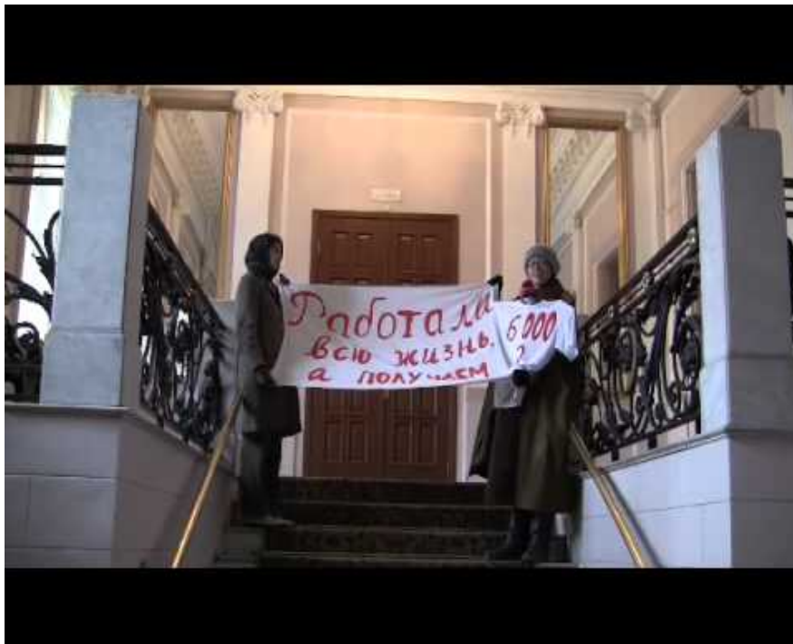
группа «Фабрика Найденных Одежд» / видео «Несанкционированный пикет в поддержку пенсионеров» / 2011

Но если появилась выразительность, то манифест пропал?