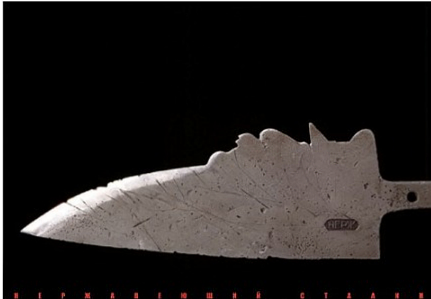
© Владимир Цеслер / "Нержавеющий Сталин"