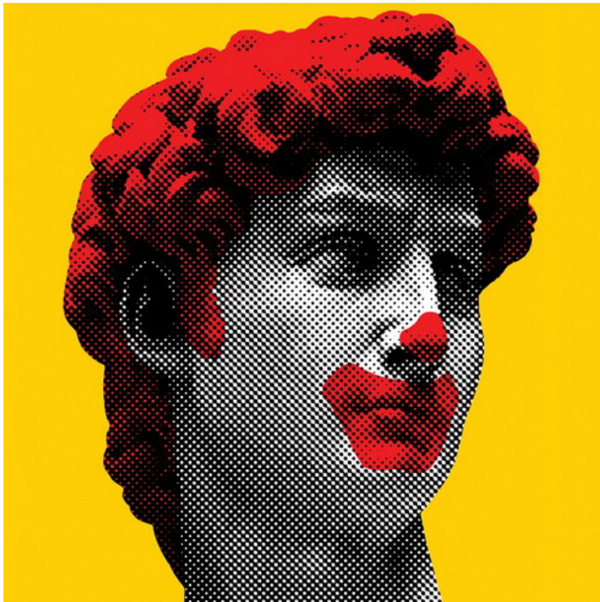
© Владимир Цеслер / McDavid's Smile / 2011

О «переломе»: конец 1980-х – начало 1990-х гг.