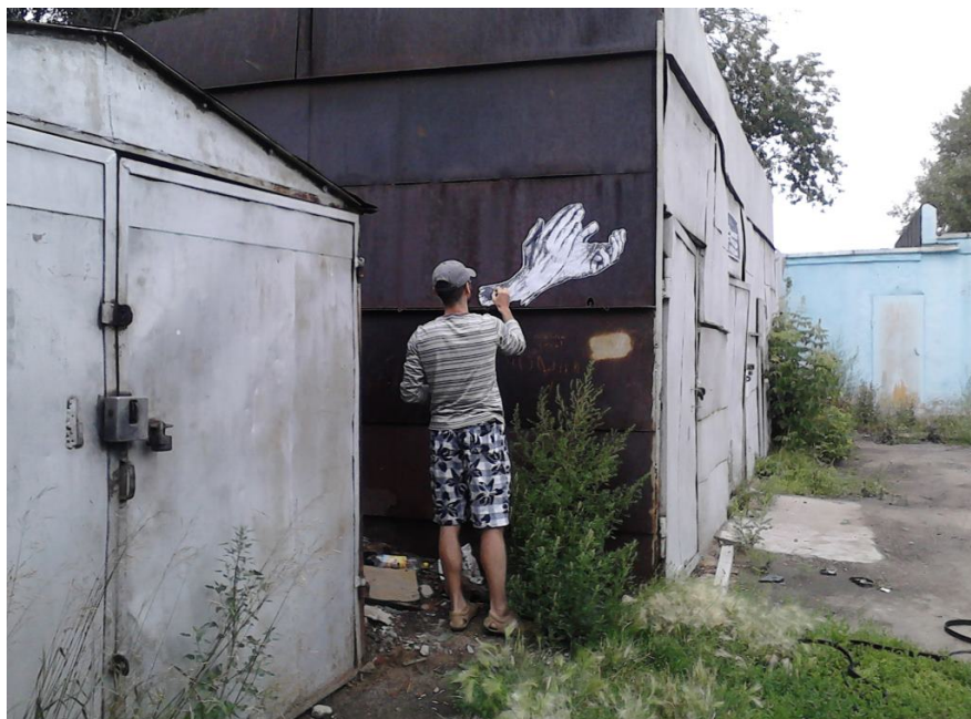
«Выставка по Средам» / Омск

В этой выставке приняли участие Амстердам, (Нидерланды), Астрахань, Калуга, Москва, Омск, Сургут, Уфа, Пермь (Россия), Берлин, Вецлар, Лейпциг, Баден-Баден, Дрезден (Германия), Лондон (Великобритания), Минск (Беларусь), Нью-Йорк (США), Рейкьявик (Исландия), Ход хаШарон (Израиль), Черветери (Италия).