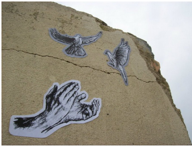
Вторая «Выставка по средам» / Лейпциг

Один из основателей проекта, художник Дмитрий Врубель, представляет его описание следующим образом, делая отсылку к одной из «картинок»: «В новой картинке на тему «английского бунта» всё очень важно: человек показывает средний палец, и одновременно он закрывает своё лицо. Это воспоминание о тоталитарной «фиге в кармане» в век тотальной информации. Это F*ck той власти, которая создаёт невыносимую ситуацию, годами ничего не говорит о ней, не может предотвратить насилие и не может с ним справиться.