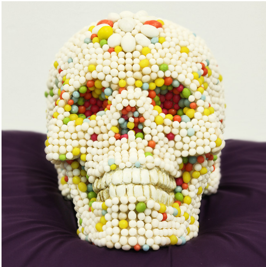
© Михаил Гулин / Dolce Morte / 2011