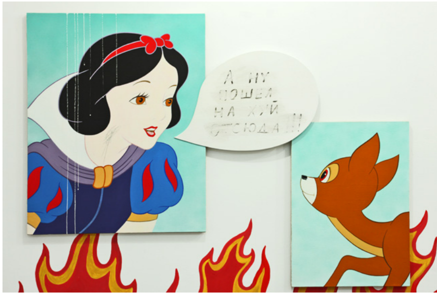
© Михаил Гулин / диптих "Послание" / 2010

пространство. Мне кажется, что в Беларуси проводится очень мало выставок, где художники и кураторы задумываются о цельности выставочного пространства, о зрителе.