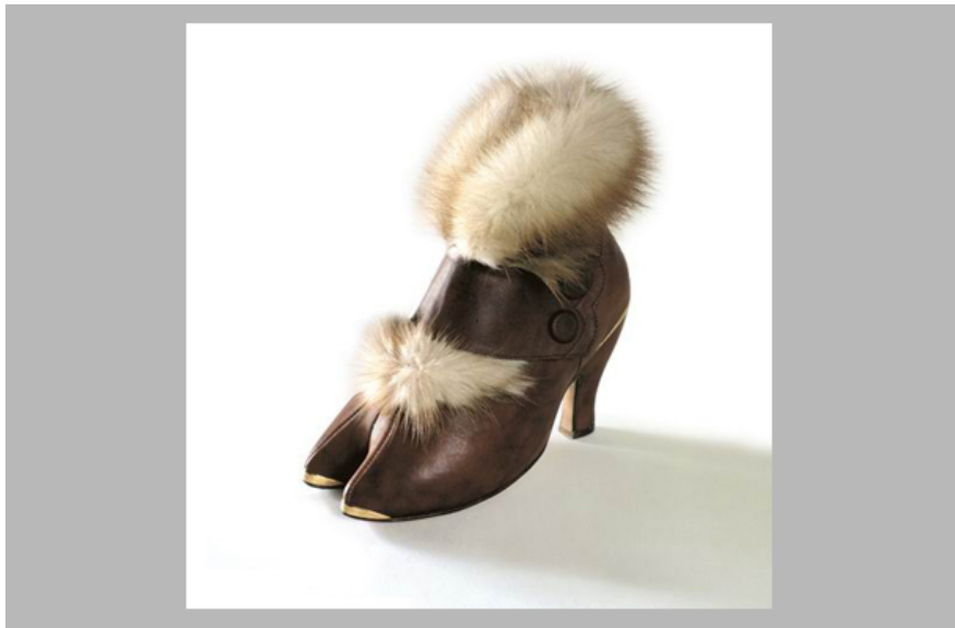
Владимир Цеслер / "Ботинок" // источник: www.tsesler.com ©

Слова «Свабода» — жаночага роду, а ягоны сынонім «Воля» дык увогуле супадае з папулярным жаночым імем. Калі 20 сакавіка на Плошчы пасьяла абаяльнага няўдачніка Аляксандра Мілінкевіча слова ўзяла ягоная жонка Іна Кулей, адразу стала зразумела, хто гаспадарыць у вясковым доме недзе на Шчучыншчыне. «Вось бы каго ў прэзыдэнткі! — захоплена сказаў хтосьці побач. — Ну чаму ў нас няма жанчын-кандыдатак?» Але ў нашай краіне ніколі ня будзе матрыярхату, таму ў ёй ніколі ня будзе рэвалюцыі. Сустракаеш цяжарную сяброўку, кладзеш ёй руку на живот і пытаеся: «Каго чакаеш: дзяўчынку ці няўдачніка?»