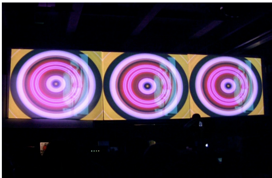
Фото / Mix box / фрагмент видео an angelico / LPM X 2011 / клуб Loft Minsk