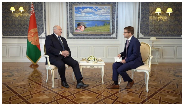
Фотомонтаж. На фотографии изображена подлинная картина И. Бархаткова, купленная Приорбанком в 2014 году.

Вот-вот появятся? Этот вопрос стоит особняком, так как часто природа в полотнах белорусских художников заряжается потенцией к изменениям. Из-за холма, подернутого дымкой, может кто-то появиться, а в окошке будто бы заброшенного домика у леса задрезжит огонек. Однако здесь важно говорить об определенном уровне усложнения. Сейчас попытаемся описать его. Если в природном мотиве и появляется человек, то он в ту же секунду начинает диктовать некий контекст, время, событие. Пейзаж в одночасье становится политическим. Это накладывает ряд вопросов к роли и позиции художника, часто стремящегося не запятнать себя участием в социально-политических событиях. Быть поодаль, наблюдать со стороны, как наблюдать со стороны на ветви деревьев, шевелящиеся от легкого дуновения ветерка. Роль мудрого наблюдателя исключает соучастие, ведь время идет и нужно дать ему дорогу. Поэтому для белорусской пейзажной школы характерен высокий возраст художников, одновременно несущий с собой опыт, традицию, а, с другой стороны, говорящий о неформально сложившейся линии поведения, позволяющей выжить даже в самые трудные времена.