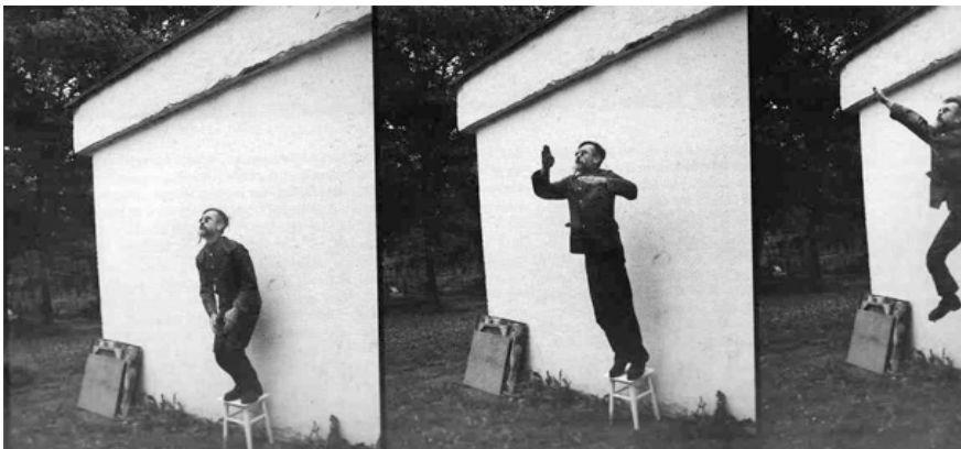
© Виталий Калгин (Бисмарк) / из цикла «Пропаганда»

Судьба Бисмарка более трагична, что, впрочем, отвечает и критическому пафосу его работ, отличных от фантазийно-романтической живописи Хацкевича. Одна из основных тем творчества Бисмарка, о чем можно судить по представленной в «pARTisan'e» документации, — это работа с памятью или конструирование прошлого. Причем Бисмарк, что следует и из его творческого псевдонима, обращается к самому что ни на есть травматическому прошлому — к войне.