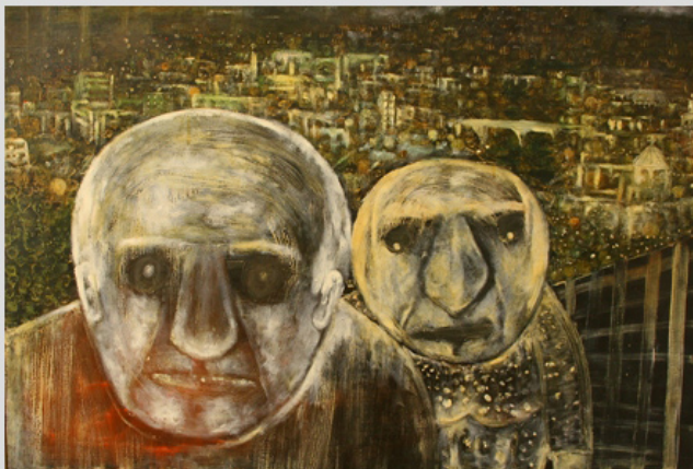
© Алексей Жданов / «Хмурое утро» / 80-е

Другой материал журнала, посвященный современному белорусскому художнику А.Р.Ч. (псевдоним Михаила Сенькова), выставка работ которого состоялась в галерее «У» в конце прошлого года, словно служит развитием главной темы творчества Алексея Жданова — обычных и в тоже время странных людей с их повседневными заботами. Однако А.Р.Ч. как будто подсматривает за ними в самые неудобные моменты, например, когда они мастурбируют или совокупаются с трупами. Перед нами очевидное посягательство на общепринятые нормы, которое не может не шокировать, поскольку живопись, да и искусство в целом, у большинства из нас всё еще ассоциируется с возвышенным и прекрасным. И кроме того, мы не привыкли задумываться над тем, кто и как конструирует эти самые нормы нашей повседневной жизни.