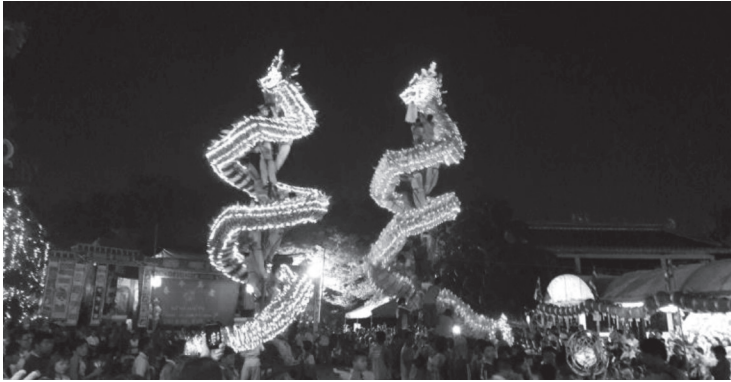
ภาพที่ ๑๓ การแสดงมังกร บันทึกรูปภาพเมื่อวันที่ ๒๘ มกราคม ๒๕๖๑