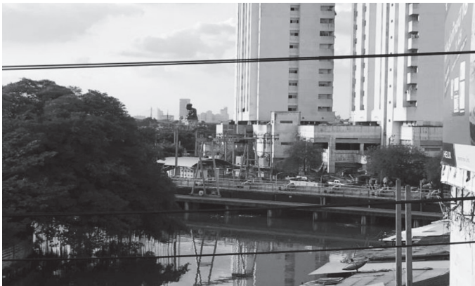
ภาพที่ ๔ ประตูปะบายน้ำกั้นเส้นทางคลองสำโรงทำให้ไม่สามารถใช้เส้นทางเดินเรือ จากบางบ่อ บางพลี ไปออกแม่น้ำเจ้าพระยาเช่นในอดีต บันทึกภาพเมื่อวันที่ ๒๑ มกราคม ๒๕๖๑