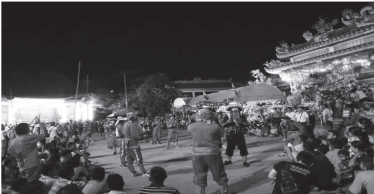
ภาพที่ ๑๗ การแสดงเอ็งกอ บันทึกรูปเมื่อวันที่ ๒๘ มกราคม ๒๕๖๑

ในเวลากลางคืนยังจัดให้มีการแสดงมหรสพต่าง ๆ ได้แก่ การแสดงเชิดมังกร การแสดงเชิดสิงโต การแสดงเอ็งกอ การแสดงจิ้ง แม้วามหรสพที่จัดขึ้นจะมีวัตถุประสงค์เพื่อแสดงถวายเจ้าพ่อท้าวก็ตาม แต่ก็สร้างความเพลิดเพลินใจให้แก่ผู้มาร่วมชมมหรสพที่จัดแสดงในเวลากลางคืนด้วย