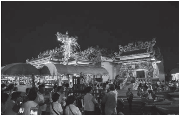
ภาพที่ ๑๐ ผู้ศรัทธามารอรับองค์เจ้าพ่อทัพเมื่อมาถึงศาลสาขาในเวลาเช้า บันทึกภาพ เมื่อวันที่ ๒๘ มกราคม ๒๕๖๑