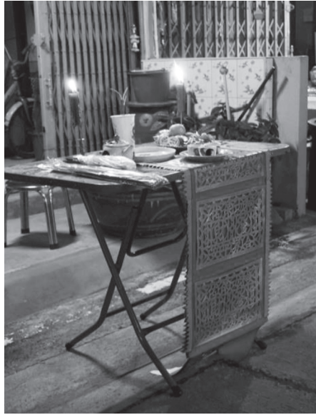
ภาพที่ ๙ โต๊ะบูชาที่ชาวบ้านตลอดสองข้างทางตั้งไว้รอรับเจ้าพ่อทัพเมื่อผ่านหน้าบ้าน บันทึกภาพเมื่อวันที่ ๒๘ มกราคม ๒๕๖๑