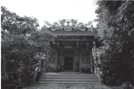
ภาพที่ ๖ สภาพบริเวณหน้าศาลเจ้าพ่อท้าว บรรยากาศร่มรื่นด้วยต้นไม้ขนาดใหญ่ บันทึกภาพเมื่อวันที่ ๒๗ มกราคม ๒๕๖๑

แต่เดิมศาลเจ้าพ่อท้าวเป็นศาลเพียงตาเสาต้นเดียว วางไม้เจริ็ดสีดำไว้ภายใน หลังจากนั้นมีการสร้างเป็นศาลไม้ขึ้นมาแทนที่ และต่อมามีกลุ่มชาวจีนที่อาศัยอยู่ในพื้นที่สำโรงที่นับถือเจ้าพ่อท้าวได้ร่วมกันสร้างศาลเจ้าพ่อท้าวขึ้น และสร้างรูปเคารพเจ้าพ่อท้าวขึ้นมาแทนไม้เจริ็ดเดิม ดังความที่วิทยากรกล่าวถึงสภาพศาลไม้ก่อนเป็นศาลเจ้าแบบจีนว่า “จำความได้เกิดมาเห็นเป็นศาลไม้ มีก่อนป่าเกิด เหมือนบ้านมี ๒ ชั้นด้านข้างมีลูกทรงไม้ มีโต๊ะและไม้เจริ็ดตั้งอยู่” (Key Informant, personal interview, 2017, January 30)