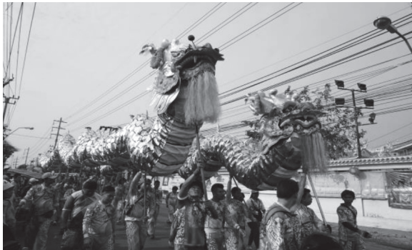
ภาพที่ ๑๒ ขบวนมังกรเงินมังกรทองในขบวนแห่เจ้าพ่อท้าว บันทึกภาพเมื่อวันที่ ๒๘ มกราคม ๒๕๖๑

ในช่วงเวลากลางคืนมีการจัดมหรสพถวายเจ้าพ่อท้าว เช่น การแสดงเชิดมังกร การแสดงเชิดสิงโต การแสดงงิ้ว การแสดงเอ็งกอก เป็นต้น เท่าที่สังเกตพบว่ามีประชาชนมาร่วมชมการแสดงกันอย่างคับคั่ง ซึ่งการแสดงมหรสพในช่วงเวลากลางคืนสร้างความสนุกสนานตื่นตาตื่นใจให้แก่ผู้มาร่วมงานอย่างมาก