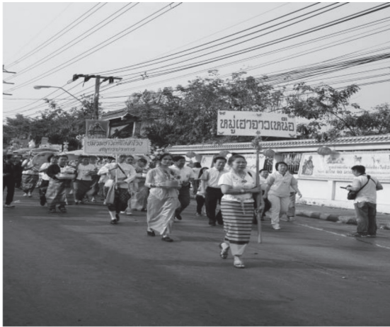
ภาพที่ ๑๔ ขบวนของชมรมชาวเหนือจังหวัดสมุทรปราการ บันทึกภาพเมื่อวันที่ ๒๘ มกราคม ๒๕๖๑

จากการสอบถามผู้ที่มาร่วมขบวนแม่เจ้าพ่อทัพนั้นทั้งเด็กและผู้ใหญ่ต่างมาด้วยความสมัครใจ แม้จะต้องเดินเป็นระยะทางไกลท่ามกลางแดดร้อนเพียงใดก็ไม่ย่อท้อ เดินร่วมขบวนจนจบ อีกทั้งยังกล่าวตรงกันว่า การได้เข้าร่วมขบวนแม่เจ้าพ่อทัพหรือการได้มามีส่วนร่วมในงานประเพณีแม่เจ้าพ่อทัพนั้นถือเป็นสิริมงคลแก่ตัวเองและครอบครัว