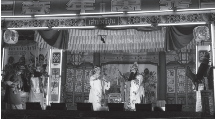
ภาพที่ ๑๘ การแสดงงิ้วจากคณะเส้าปวงนี้ชุมชน บ้านทักภาพเมื่อวันที่ ๒๘ มกราคม ๒๕๖๑