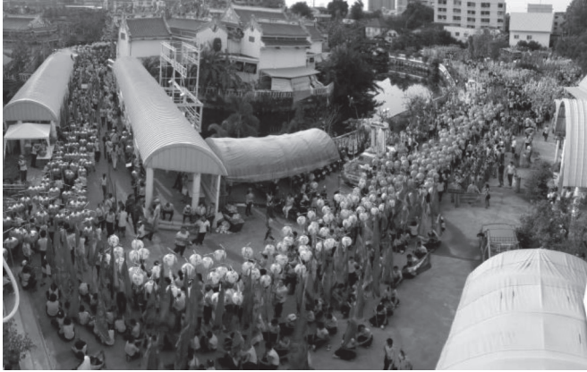
ภาพที่ ๑๕ ประชาชนผู้ศรัทธาในองค์เจ้าพ่อท้าวที่มาร่วมขบวนแห่เจ้าพ่อท้าว ขณะรอกเคลื่อนขบวน บันทึกภาพเมื่อวันที่ ๒๘ มกราคม ๒๕๖๑