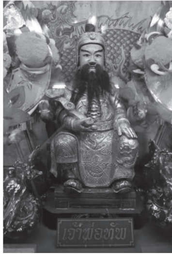
ภาพที่ ๒ รูปเคารพเจ้าพ่อท้าว บันทึกภาพเมื่อวันที่ ๓๐ มกราคม ๒๕๖๑

จากเรื่องเล่าทั้งสามสำนวนเห็นได้ว่าสำนวนที่หนึ่งและสำนวนที่สองนั้นปรากฏอนุภาควิัตถุลอยน้ำเช่นเดียวกัน สิ่งที่แตกต่างกันคือ สำนวนแรกกล่าวถึงวิัตถุที่ลอยน้ำมาขึ้นเป็นแผ่นไม้คล้ายป้ายดวงวิญญาน ส่วนสำนวนที่สองเป็นองค์เจ้าพ่อท้าว และทั้งสองสำนวนกล่าวตรงกันเกี่ยวกับการอัญเชิญวิัตถุที่ลอยน้ำขึ้นมานบถและสร้างศาลให้ ส่วนสำนวนที่สามนี้มีความแตกต่างจากสองสำนวนแรก เพราะวิทยากรไม่ได้กล่าวถึงอนุภาควิัตถุลอยน้ำ แต่กล่าวถึงเจ้าพ่อท้าวว่าเป็นทหารที่มารบและเสียชีวิตในบริเวณดังกล่าว และแสดงชาติพันธุ์ของกลุ่มชนของวิทยากรเข้าไปในเรื่องเล่า เนื่องจากวิทยากรเป็นคนไทยเชื้อสายมอญ เมื่อเล่าเรื่องเกี่ยวกับเจ้าพ่อท้าวจึงได้กล่าวถึงเชื้อสายของเจ้าพ่อท้าวว่ามีเชื้อสายมอญปนจีน ซึ่งเป็นการผสมผสานเชื่อมโยงระหว่างชนสองกลุ่มคือกลุ่มชาวจีนและชาวมอญ