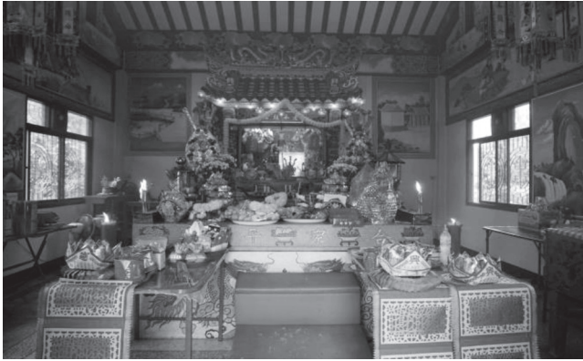
ภาพที่ ๗ สภาพภายในศาลเจ้าพ่อท้าว บันทึกรูปเมื่อวันที่ ๒๗ มกราคม ๒๕๖๑

ศาลเจ้าพ่อท้าวมีขนาดไม่ใหญ่มากนัก บรรยากาศเงียบสงบร่มรื่น ด้านหน้าบริเวณติดริมคลองสำโรง เป็นที่ตั้งของแท่นโห่ฟ้าดินอยู่ด้านหน้า เมื่อเดินเข้าไปภายในศาลจะพบแท่นวางผลไม้และสิ่งของที่ผู้มีศรัทธานำไปถวาย ถัดจากแท่นวางผลไม้และเครื่องบูชาเป็นแท่นวางกระถางธูปจำนวน ๕ ใบ กระถางธูปใบใหญ่สุดตั้งอยู่ตรงกลางเป็นกระถางธูปของเจ้าพ่อท้าว ถัดจากแท่นวางกระถางธูปเป็นที่ตั้งของรูปเคารพเจ้าพ่อท้าว ซึ่งตั้งอยู่ด้านในบานเลื่อนกระจก ซึ่งภายในมีเจ้าพ่อท้าว ไม้เจวีต และเครื่องบูชาต่าง ๆ ภายในศาลเจ้านอกจากจะมีรูปเคารพเจ้าพ่อท้าว และแผ่นไม้เจวีตแล้ว ยังมีตู้เจียะ ฮกลกซิว เจ้าแม่กวนอิม และจระเข้ซึ่งถือเป็นพาหนะของเจ้าพ่อท้าวตั้งอยู่