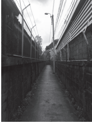
ภาพที่ ๕ บริเวณซอยทางเข้าศาลเจ้าพ่อท้าวที่ถูกขนาบด้วยโรงงานทั้งสองด้าน บันทึกภาพเมื่อวันที่ ๒๗ มกราคม ๒๕๖๑

ดังนั้นการเดินทางมาศาลเจ้าพ่อท้าวจึงสามารถมาได้เพียงเส้นทางเดียวเท่านั้น คือทางบก แต่เนื่องจากศาลเจ้าพ่อท้าวตั้งอยู่ในซอยแคบ ๆ เชื่อมกับบริเวณวัดมหาวันซ์ รถยนต์จึงไม่สามารถผ่านเข้าออกได้ ผู้ที่จะเข้ามาศาลเจ้าพ่อท้าวจึงต้องเดิน ใช้รถ จักรยาน หรือรถจักรยานยนต์เท่านั้น