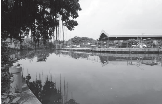
ภาพที่ ๓ สภาพลำคลองสำโรงหน้าศาลเจ้าพ่อท้าวในปัจจุบันไม่ได้ใช้เป็นเส้นทาง การคมนาคมเช่นในอดีต บันทึกภาพเมื่อวันที่ ๒๔ กุมภาพันธ์ ๒๕๖๑