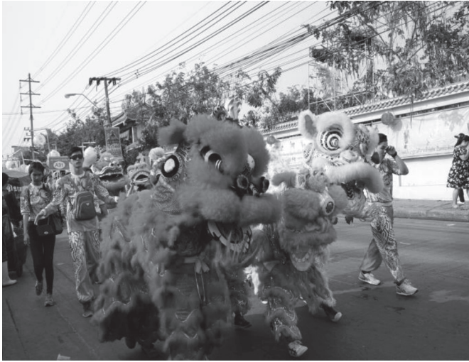
ภาพที่ ๑๖ ขบวนสิงโตในขบวนแห่เจ้าพ่อท้าว บันทึกรูปเมื่อวันที่ ๒๘ มกราคม ๒๕๖๑

ในเวลากลางคืนยังจัดให้มีการแสดงมหรสพต่าง ๆ ได้แก่ การแสดงเชิดมังกร การแสดงเชิดสิงโต การแสดงเอ็งกอ การแสดงจิ้ง แม้วามหรสพที่จัดขึ้นจะมีวัตถุประสงค์เพื่อแสดงถวายเจ้าพ่อท้าวก็ตาม แต่ก็สร้างความเพลิดเพลินใจให้แก่ผู้มาร่วมชมมหรสพที่จัดแสดงในเวลากลางคืนด้วย