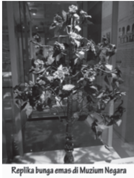
รูปที่ ๑ ต้นไม้เงินต้นไม้ทอง

ลักษณะทั่วไปของดอกไม้เงินดอกไม้ทองหรือต้นไม้เงินต้นไม้ทองได้บันทึกไว้ในเอกสารทางประวัติศาสตร์และรูปภาพของทั้งไทยและต่างประเทศ ในสมัยกรุงศรีอยุธยาปรากฏในเอกสารทางวิชาการด้านประวัติศาสตร์เอเชียตะวันออกเฉียงใต้ของประเทศมาเลเซียระบุว่า (Bunga emas, p. 288) มีความสูงประมาณ ๑.๘ เมตร ลำต้นทำมาจากไม้สักแล้วหุ้มด้วยทองคำบริสุทธิ์อีกชั้นหนึ่ง มีฐานสามารถตั้งได้