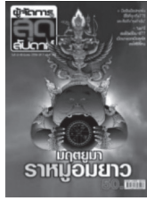
ภาพที่ ๗ ภาพพระราหูบนปกนิตยสารผู้จัดการสุดสัปดาห์ ที่มา: ปกนิตยสารผู้จัดการสุดสัปดาห์ ปีที่ ๗ เล่มที่ ๓๑๒ พ.ศ.๒๕๕๐

ตัวอย่างที่ปรากฏให้เห็นก็คือหน้าปกนิตยสารผู้จัดการสุดสัปดาห์ได้เสนอภาพพระนารายณ์ทรงครุฑยุคนาคประทับพระราหูอยู่ตรงบริเวณกลางภาพ ด้านล่างของภาพปรากฏคำบรรยายว่า “มฤตยูมา ราหุอมยาว” ลักษณะพระราหูในภาพปกนิตยสารดังกล่าวปรากฏคล้ายกับอดีตผู้ว่าราชการจังหวัดกรุงเทพฯ คือ ม.ร.ว.สุขุมพันธุ์ บริพัตร ซึ่งมีชื่อเล่นว่า “หมู” กำลังใช้มือทั้งสองข้างกำลังจับและอมวัตถุที่มีลักษณะเป็นวงกลมสีดำลงอีกกระชั้น