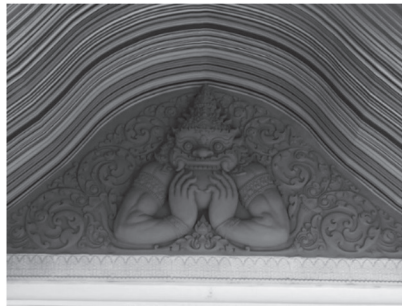
ภาพที่ ๙ ราหูลายปูนปั้นพระราหูประดับด้านหน้าโรงแรมโมเดิร์นทาวเวอร์ดี จังหวัดนครปฐม