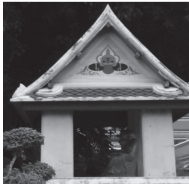
ภาพที่ ๔ พระราหูอมพระอาทิตย์ที่สวนมิสกวัน

ผู้วิจัยสันนิษฐานว่าพระราหูที่สวนมิสกวันนี้เป็นภาพที่วาดขึ้นเพื่อจุดประสงค์ อธิบายถึงตำนานพระพุทธรูปนอนปางปราบอสูรินทราหูซึ่งสร้างไว้ในวิหารพุทธไสยาสน์ อันเป็นเรื่องที่สอดคล้องกับเรื่องเล่าที่ปรากฏในสุริยสูตรและจันทรสูตรในพระสุตันต- ปิฎก