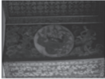
ภาพที่ ๒ พระราหูไล่จับพระจันทร์ที่วัดพระเชตุพนวิมลมังคลาราม

ภาพพระราหูที่วัดพระเชตุพนฯ ปรากฏหลักฐานการเปลี่ยนแปลงขนบการวาดภาพพระราหูที่สำคัญอยู่ในส่วนของบริเวณเขตพุทธาวาส ๓ แห่ง ได้แก่ ภาพพระราหูที่คอสองในพระประธานพระอุโบสถซึ่งอยู่ภายนอกตัวอาคารอันมีจุดประสงค์เพื่อยืนยันยืนยันความเป็นจักรวาลของพื้นที่ศักดิ์สิทธิ์ ภาพพระราหูที่ศาลารายสร้างขึ้นโดยมีจุดประสงค์เพื่ออธิบายถึงรูปแบบโรคภัยโดยใช้ภาพสัญลักษณ์ของพระราหูแทนความหมายโรคภัยของเด็ก ซึ่งเรียกว่า “รำบองราหู” และที่สุดท้ายคือภาพพระราหูที่ศาลาคู่หน้าสวนมีสกวันหลังวิหารพระพุทธไสยาสน์ ซึ่งสันนิษฐานว่าเป็นภาพที่วาดขึ้นเพื่อจุดประสงค์ที่จะอธิบายถึงพระปางพุทธไสยาสน์ว่าเป็นปางปราบอบสุรินทรราหูซึ่งสอดคล้องกับเรื่องเล่าที่ปรากฏในสุริยสูตรและจันทรสูตรในพระสุตันตปิฎก