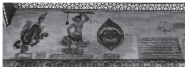
ภาพที่ ๓ รำบองราหู

ภาพพระราหูอีกที่หนึ่งของวัดพระเชตุพนก็คือภาพรำบองราหูที่ศาลาแม่ชื้อบริเวณหน้าด้านหน้าพระมหาเจดีย์ ๔ รัชกาล ภาพพระราหูดังกล่าวมีจุดประสงค์เพื่ออธิบายถึงรูปแบบโรคภัย โดยใช้ภาพสัญลักษณ์ของพระราหูแทนความหมายโรคภัยของเด็ก ซึ่งเรียกว่า “รำบองราหู” โดยมีทั้งหมด ๑๒ กลุ่มภาพ ในแต่ละกลุ่มภาพจะมีภาพประกอบกันอยู่ ๓ ภาพ ตัวอย่างเช่น ภาพรำบองราหูสำหรับทำพิธีบูชาแก้โรคภัยของเด็กที่เกิดในราศีตุลย์ ในภาพจะมีองค์ประกอบคือด้านขวามือของภาพมีจารึกกำกับไว้ว่า “รูปนี้เสียข้างขึ้นเป็นภาพโกรสรจำแลงนี้มีกายมีสีเขียวนิลตลอดกำลังแสดงอาการกระโจนลงมา”