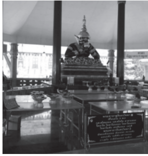
ภาพที่ ๖ พระราหูวัดศิระทองจังหวัดนครปฐม

นอกจากงานปั้นและงานหล่อพระราหูแล้วยังพบประติมากรรมงานแกะสลักไม้เป็นรูปพระราหูขนาดใหญ่ โดยพบที่วัดหลักสี่ราษฎร์สโมสร ตำบลยกกระบัตร อำเภอบ้านแพ้ว จังหวัดสมุทรสาคร เป็นพระราหูแกะสลักจากไม้ และบางครั้งพระราหูก็อาจปรากฏร่วมกับเทพในศาสนาพราหมณ์-ฮินดูอื่น ๆ เช่น ที่วัดบางไผ่ จังหวัดสมุทรปราการ วัดสมานรัตนาราม จังหวัดฉะเชิงเทรา พบรูปปั้นพระราหูปรากฏร่วมกับพระพิฆเนศ