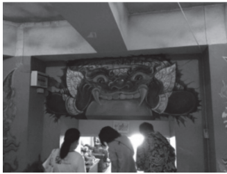
ภาพที่ ๘ พระราหูวัดบางจาก จังหวัดนนทบุรี