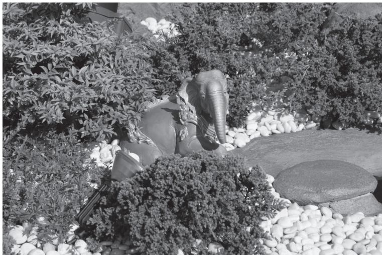
กฤษชรวารี (ช้างและปลา)