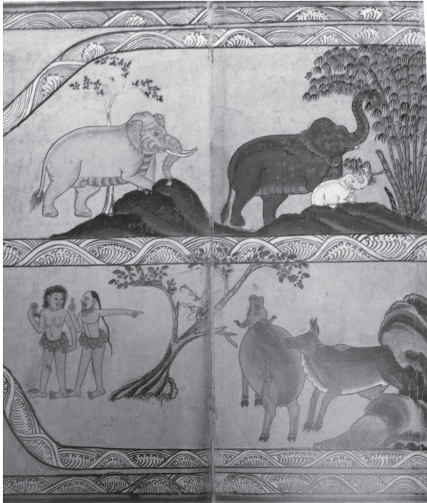
งานเขียนสีรูปสัตว์ต่างๆ และคนป่าในป่าหิมพานต์