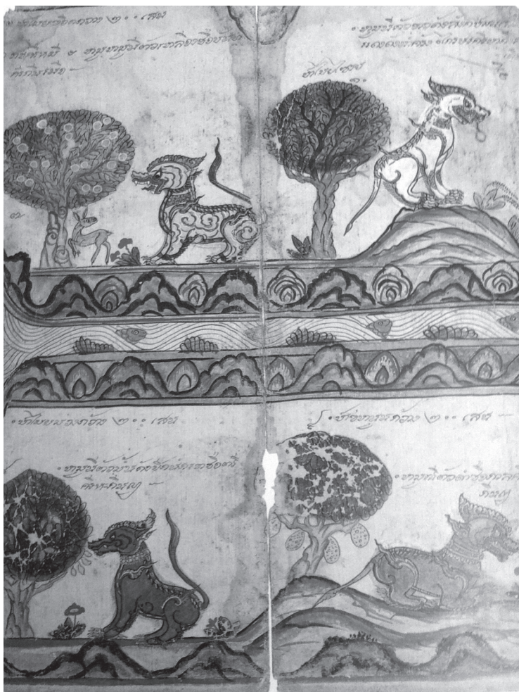
งานเขียนสิริุปรราชสีห์ ๔ หมู่ ในป่าหิมพานต์ ๑๑