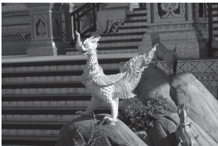
นกหัสติลิงค์ (นก ช้าง และสิงห์)