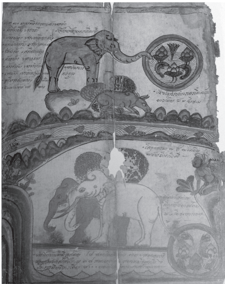
งานเขียนสีรูปช้างต่างๆ ในป่าหิมพานต์ ๑๒