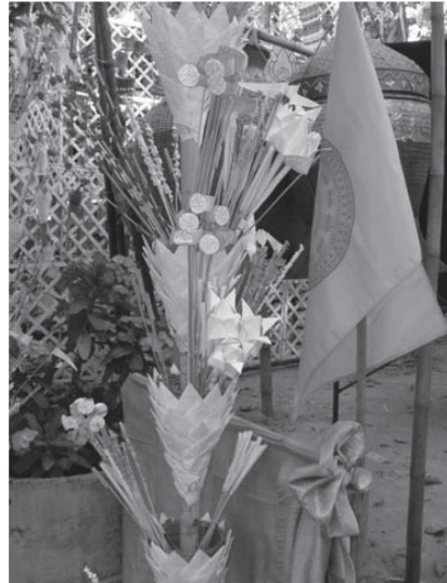
ภาพซ้าย: ธงไชยที่ประดิษฐ์ขึ้นในงานบุญแปดหมื่นสี่พันขันธ์ ภาพขวา: ภาพเครื่องประกอบพิธี