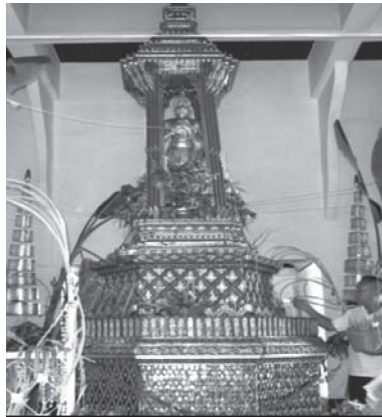
ภาพที่ ๑ เสาดินทขิลในปัจจุบัน มีพระพุทธรูปปางรำพึงครอบอยู่ด้านบน