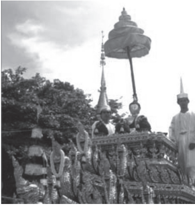
ภาพที่ ๒ พระพุทธรูปฝนแสนห่าบนรถ บุษบก ศรีเมืองเชียงใหม่ มี เทวดารักษา