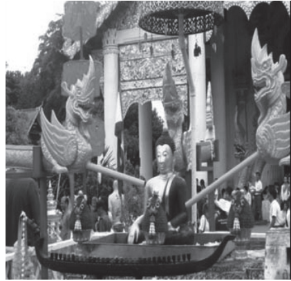
ภาพที่ ๓ พระพุทธรูปฝนแสนห่าประดิษ- ฐานไว้หน้าวิหารให้ประชาชน สร่งน้ำผ่านพญานาคทั้งสาม

จากประวัติความเป็นมาของพระพุทธรูปฝนแสนห่าแสดงให้เห็นว่า พระพุทธรูปฝนแสนห่าเพิ่งเข้ามาประดิษฐานในเชียงใหม่สมัยพระเจ้าติโลกราช กษัตริย์องค์ที่ ๙ แห่งราชวงศ์มังราย ในขณะที่พิธีบูชาเสาอินทขิลได้กระทำสืบเนื่อง มาก่อนหน้านี้แล้ว นอกจากนี้ยังไม่ปรากฏหลักฐานเป็นที่แน่ชัดว่าพระพุทธรูปฝน แสนห่าเริ่มเข้ามามีบทบาทในพิธีบูชาเสาอินทขิลตั้งแต่เมื่อใด อย่างไรก็ตาม ลักษณะ การดำรงอยู่ของพิธีกรรมในปัจจุบันที่มีพระพุทธรูปฝนแสนห่าเป็นองค์ประกอบ สำคัญนับเป็นการนำสัญลักษณ์ทางพุทธศาสนาเข้ามาผนวก ด้วยความเชื่อที่มีต่อ พระพุทธรูปองค์นี้ว่า “ช่วยให้ฝนฟ้าตกต้องตามฤดูกาล ช่วยที่บ้านเมืองอุดม สมบูรณ์” นั้น สอดรับกับวัตถุประสงค์ของการประกอบพิธีบูชาเสาอินทขิลซึ่งกระทำ เพื่อความอุดมสมบูรณ์ของบ้านเมืองเช่นเดียวกัน การเข้ามาผสมผสานเชิงสัญลักษณ์ ทางพุทธศาสนาในข้อนี้จึงถือเป็นการเข้ามาส่งเสริมและช่วยเน้นย้ำความหมายของ พิธีกรรมให้ชัดเจน