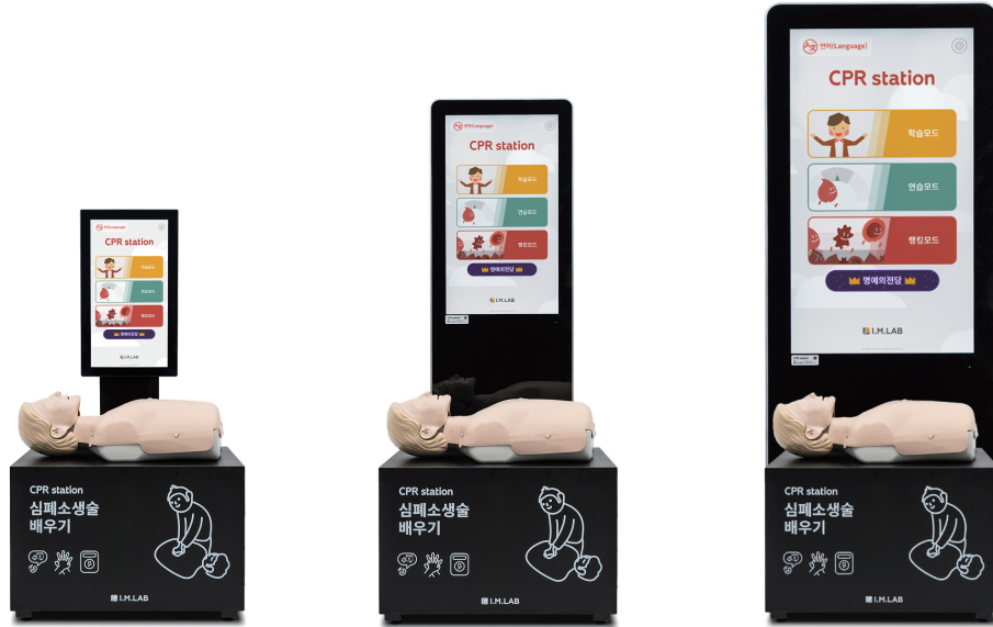
CPR station lite