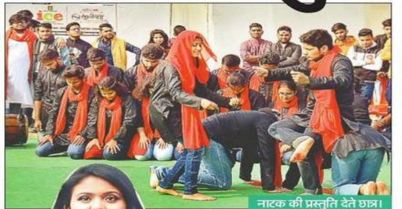
नाटक की प्रस्तुति देते छात्र।

82 प्रतिभागियों ने भाग लिया। प्रतियोगिता में टीम अर्चीता पहले स्थान पर रही। शंकरा व मेलोमईड टीम क्रमशः दूसरे-तीसरे स्थान पर रही। स्वतंत्रता भवन में रॉक बैंड की धुन पर लोग थिरक उठे। बीस जनवरी तक चलने वाले महोत्सव में शुक्रवार को कार्यक्रम की शुरुआत राजपूताना ग्राउंड में नुक्कड़ हुल्लंड से हुई। इसमें