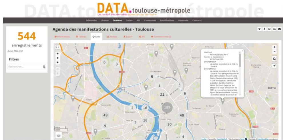
Exemple de représentation géolocalisée des données (agenda des manifestations culturelles sur le site de Toulouse Métropole)