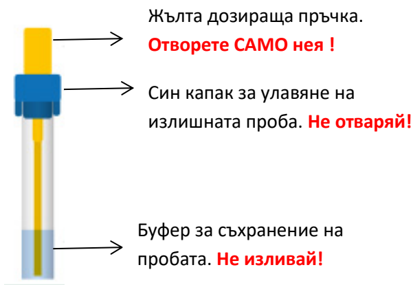
Фигура 1: Епруветка за взимане на проба за серотонин:

След това завъртете дозиращата пръчка, така че да щракне.