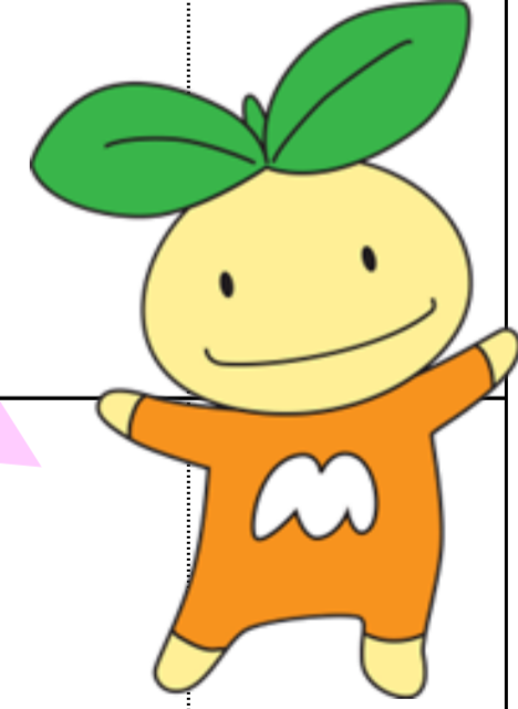
東近江市こども施策PRキャラクター こども未来ちゃん

頭の新芽はこどもの成長を表しています。胸の「M」と「M」の形をした翼は、「未来」と「ME（ミー）わたし」の意味を表し、白色にすることで可能性を表現しています。