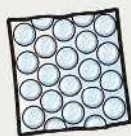
気泡シート (プチプチ)

汚れていない以下のものは「②プラスチック容器包装」です。 (汚れている場合は「燃やせるごみ」へ。)