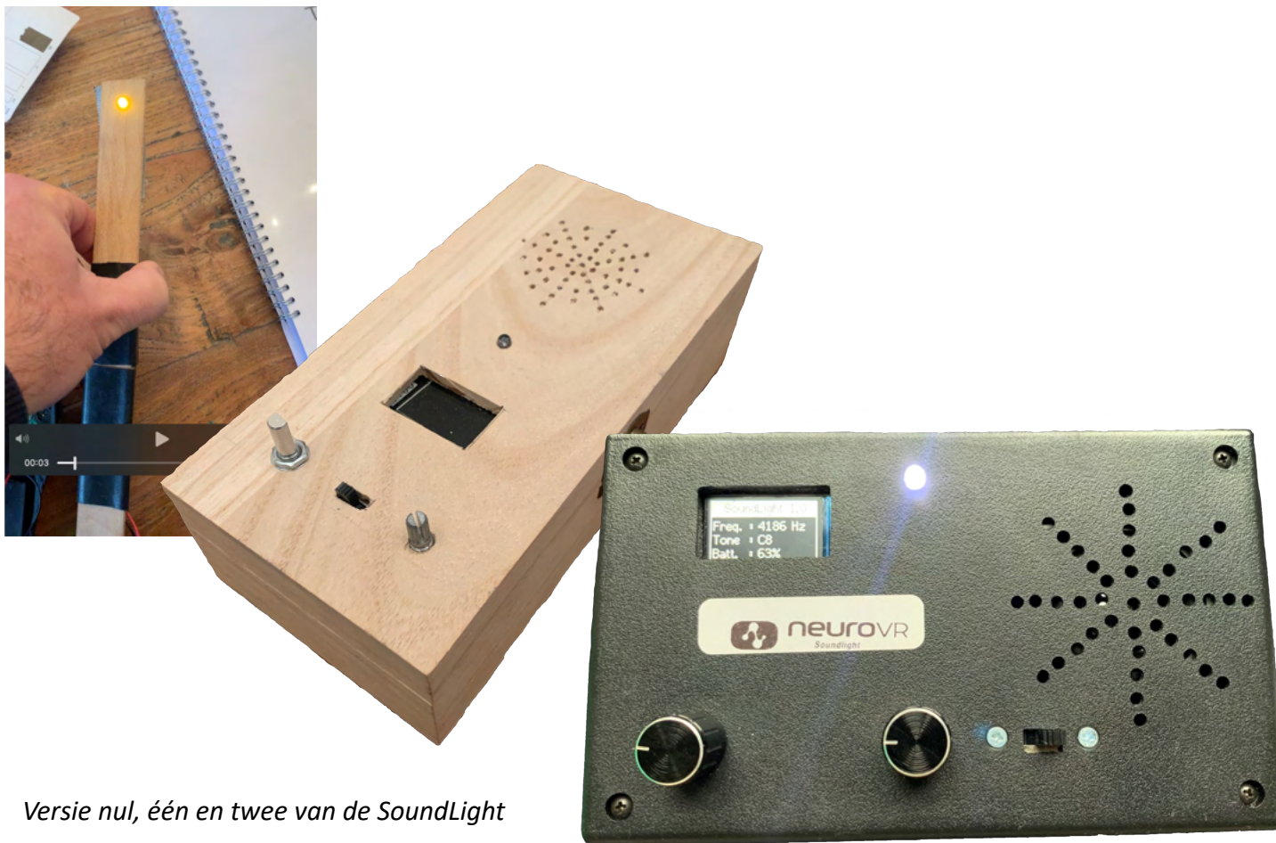
Versie nul, één en twee van de SoundLight