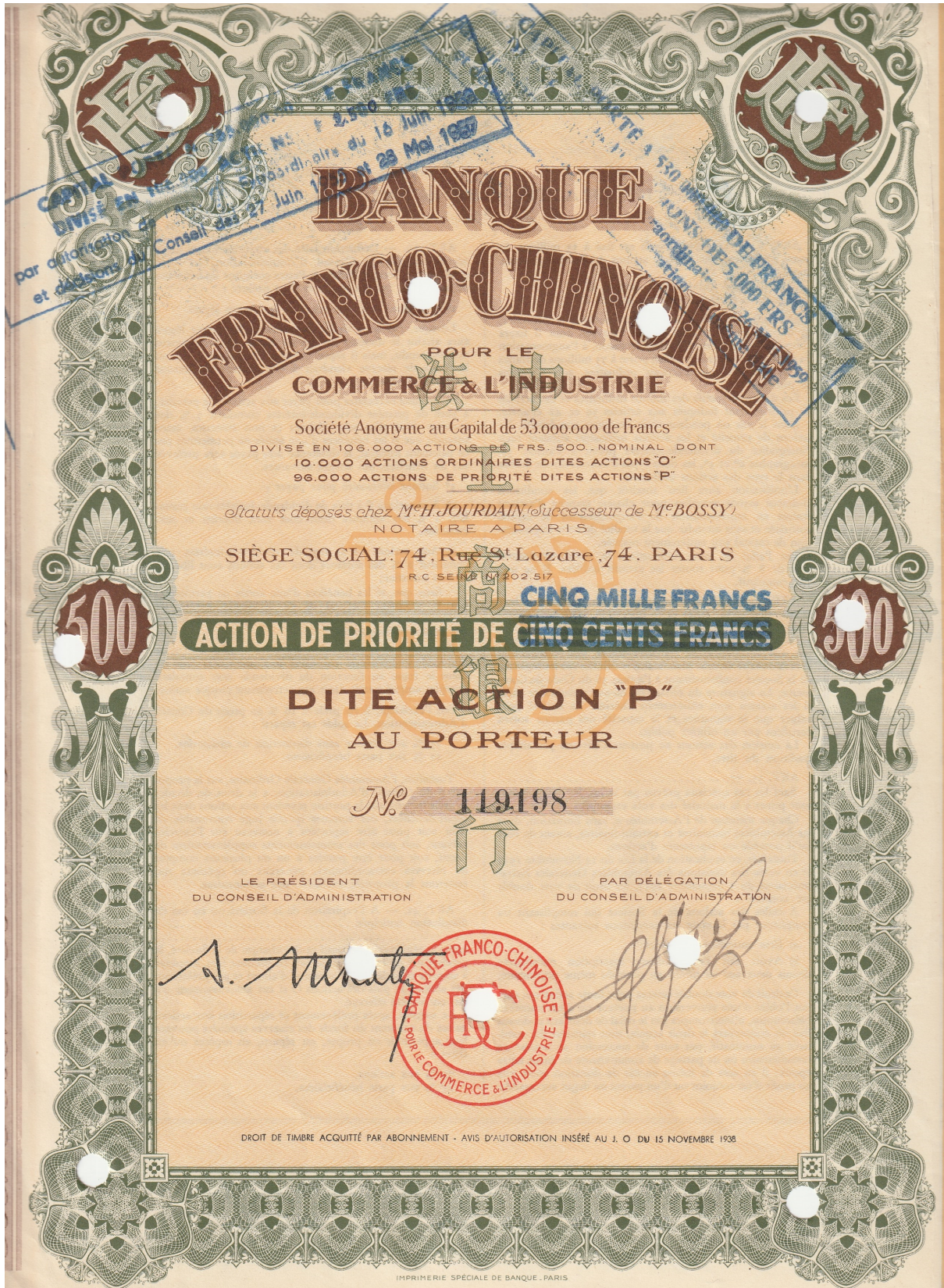
BANQUE FRANCO-CHINOISE POUR LE COMMERCE ET L'INDUSTRIE Société anonyme au capital de 53.000.000 fr. divisé en 100.000 actions de fr. 500 nominal dont