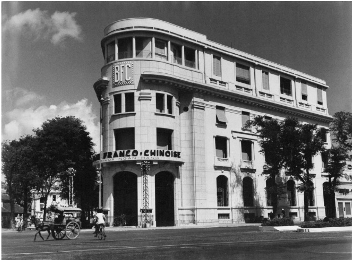
Agence de la Banque franco-chinoise à Saïgon